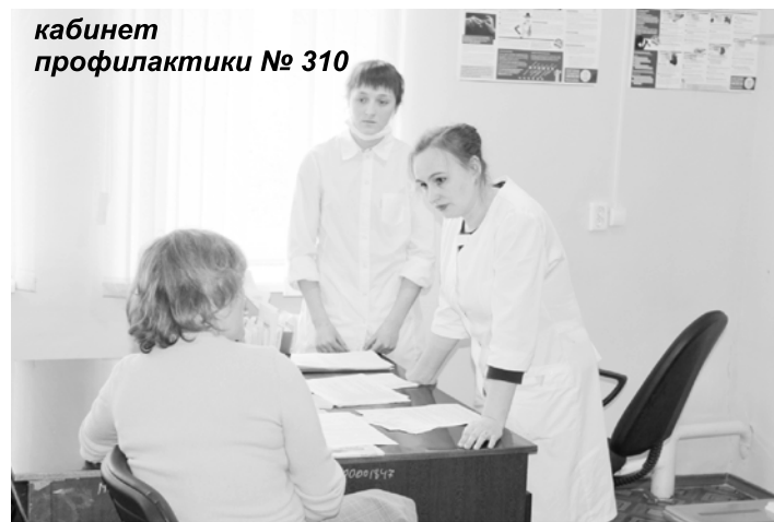
кабинет профилактики № 310