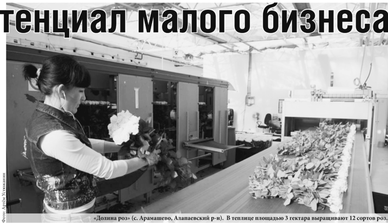
«Долина роз» (с. Арамашево, Алапаевский р-н). В теплице площадью 3 гектара выращивают 12 сортов роз.

Малый и средний бизнес отметил в конце мая свой профессиональный праздник – День предпринимателя. По мнению губернатора Евгения Куйвашева, деловая инициатива в Свердловской области развивается высокими темпами. В рамках поддержки малого и среднего предпринимательства проводятся обучающие программы, начинающим предоставляются гранты для реализации бизнес-проектов, тем, кто занят в реальном секторе экономики, выделяются субсидии на модернизацию оборудования. Всё это вносит весомый вклад в решение социально-экономических задач региона, улучшение делового климата, повышение устойчивости экономики.