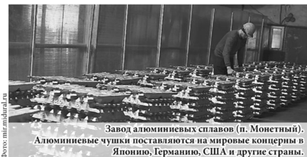
Завод алюминиевых сплавов (п. Монетный). Алюминиевые чушки поставляются на мировые концерны в Японию, Германию, США и другие страны.

...Под таким названием в рамках празднования Дня российского предпринимательства в Доме журналистов открылась фотовыставка уральских предприятий.