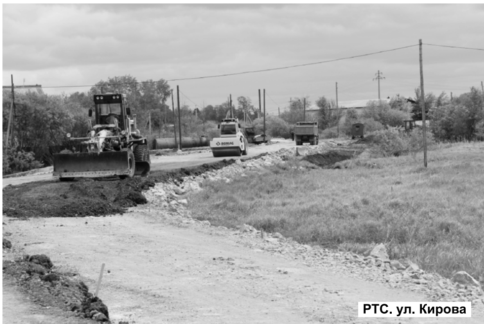
РТС. ул. Кирова

В родительский день, направляясь на городское кладбище, каждый таличанин отметил, кто - про себя, а кто и в полный голос - состояние дороги по улице Калинина. Об этом же был звонок и Л.Ф. Кузнецова. Он не только указал на плохое состояние ул. Комсомольской, Пролетарской, 8 Марта, но и поинтересовался, почему нет контроля за качеством выполненных работ. Ведь дорогу по Калинина ремонтировали всего два года назад, а сегодня мы близких людей в последний