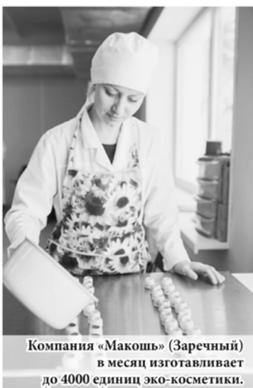
Компания «Макошь» (Заречный) в месяц изготавливает до 4000 единиц эко-косметики.

Получить инвесткредиты смогут также предприниматели из таких приоритетных отраслей, как производство товаров, переработка сельхозпродукции, гостиничный бизнес, инновационные предприятия.