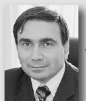
Николай Смирнов, министр энергетики и ЖКХ региона:

«Качественное и своевременное проведение капитальных ремонтов сегодня – это тот ресурс, который позволяет не наращивать объём аварийного жилого фонда в будущем. Именно на такой «хозяйский» подход нас нацеливает Президент России».