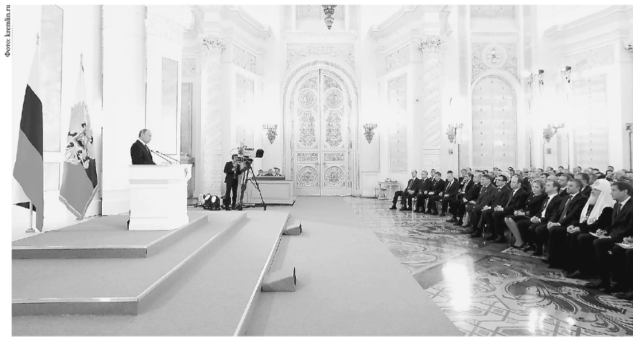
«Смысл всей нашей политики – это сбережение людей, умножение человеческого капитала как главного богатства России»

1 декабря 2016 года Президент РФ Владимир Путин обратился к Федеральному собранию с посланием о положении в стране и об основных направлениях внутренней и внешней политики. Акцент был сделан на социальных обязательствах государства. Уральцы, представляющие Свердловскую область в федеральных и региональных органах власти, отметили готовность к комплексной работе по выполнению поручений президента. (Стенограмма послания размещена на www.kremlin.ru )