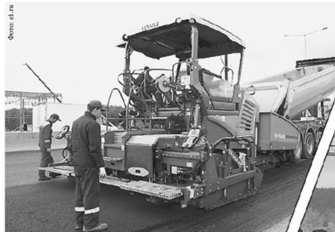
По итогам года после ремонта и капремонта планируется ввести в эксплуатацию 124 км автодорог

2016 год стал рекордным в сфере дорожного строительства. Удалось увеличить объём бюджетных ассигнований Дорожного фонда Свердловской области более чем на 4,5 млрд. рублей. Муниципалитетам на строительство, реконструкцию и ремонт дорог выделено более 5 млрд. рублей, что почти в 2,5 раза больше, чем в 2015 году. Такие данные привёл губернатор области Евгений Куйвашев в бюджетном послании Заксобранию региона. По его мнению, в современных условиях это беспрецедентные средства, результатом вложений которых должны стать современные, качественные дороги, повышение транспортной мобильности и безопасности уральцев.