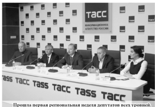
Прошла первая региональная неделя депутатов всех уровней.

Кульминацией региональной депутатской недели стало первое собрание депутатской вертикали – депутатов Государственной Думы, Заксобрания Свердловской области и Екатеринбургской городской думы.