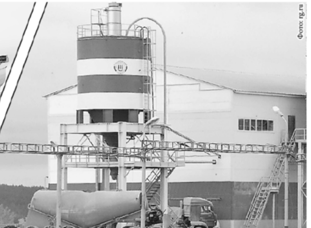
На Староцементном заводе в Сухом Логу разработали спецдобавки для крепости дорог.