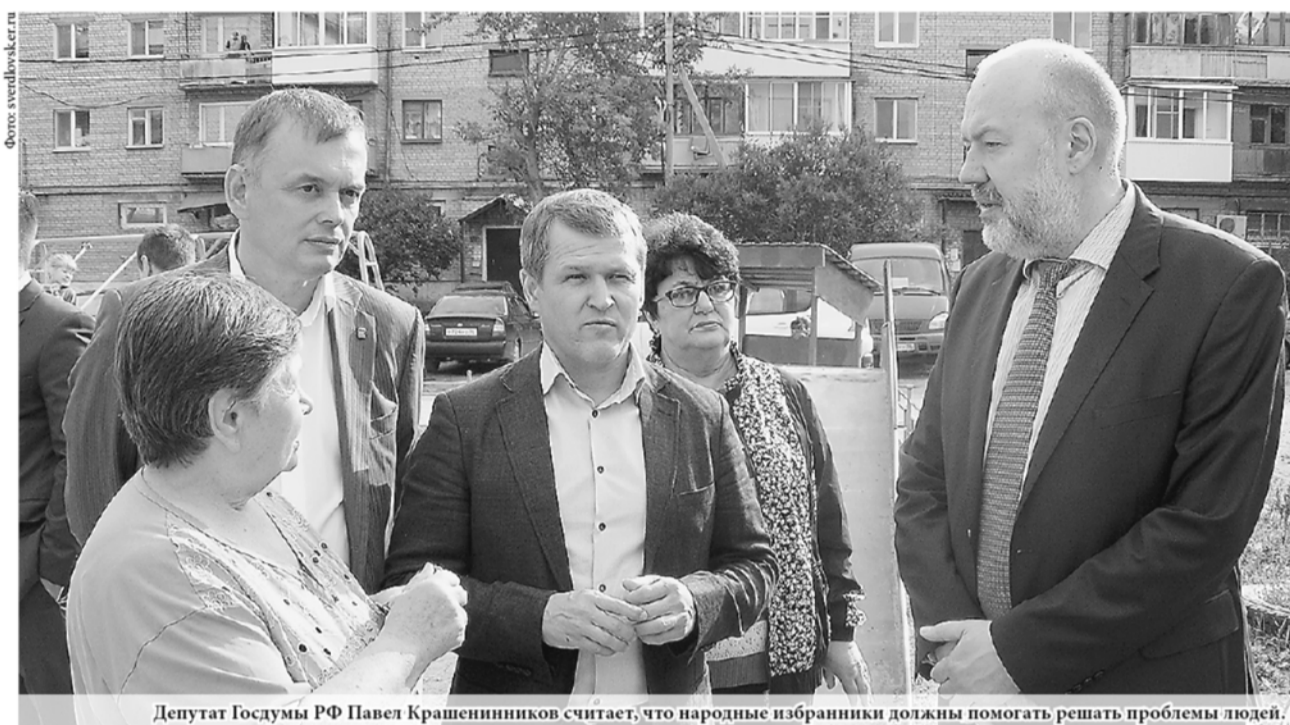
Депутат Госдумы РФ Павел Крашенинников считает, что народные избранники должны помогать решать проблемы людей.

Более 20 личных приёмов провели депутаты Государственной Думы РФ VII созыва от Свердловской области в течение прошедшей первой региональной недели. Кроме того, парламентарии встретились с коллегами из областного Заксобрания и местных дум, общественниками, экспертными сообществами, журналистами, провели серию рейдов и сформировали «депутатскую вертикаль». Главная цель региональных недель – сохранить сложившуюся во время избирательной кампании «драгоценную коммуникацию» между гражданами и кандидатами, а ныне – депутатами Государственной Думы. Отметим, следующая депутатская неделя состоится через три недели.