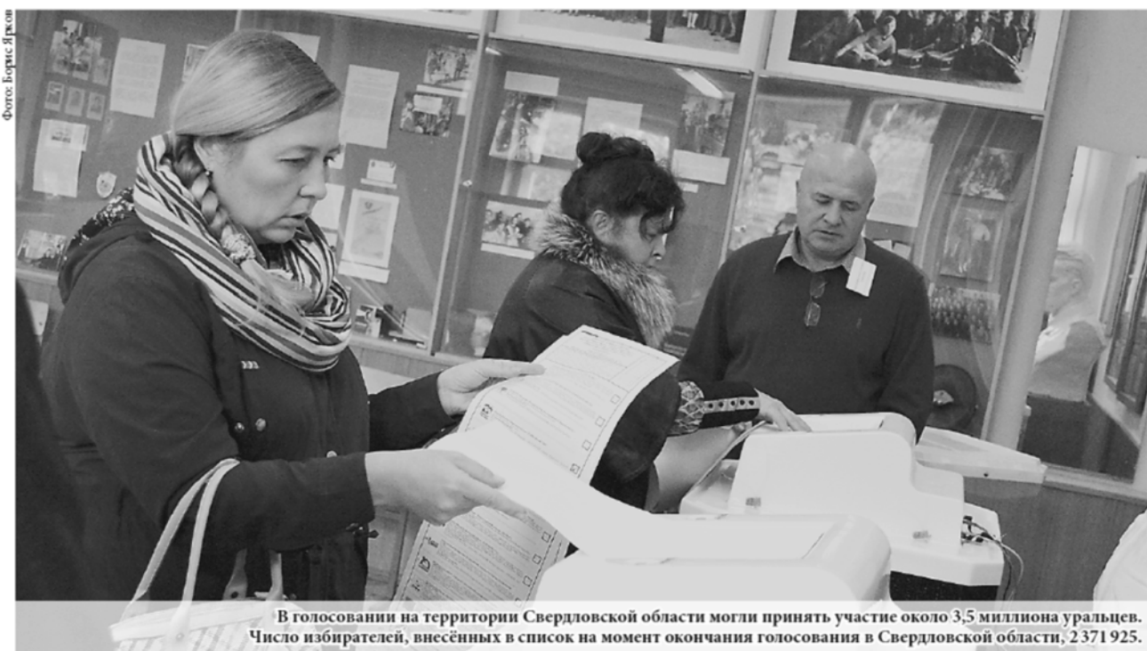
В голосовании на территории Свердловской области могли принять участие около 3,5 миллиона уральцев. Число избирателей, внесённых в список на момент окончания голосования в Свердловской области, 2 371 925.

Ранее Президент РФ Владимир Путин заявил, что выборы показали растущую политическую зрелость россиян, которые своим волеизъявлением продемонстрировали стремление к стабильной и надёжной ситуации в стране. Глава государства призвал будущих парламентариев от «Единой России» сотрудничать с другими фракциями и искать решения, которые будут приниматься всем обществом.