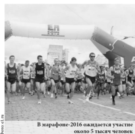
В марафоне-2016 ожидается участие около 5 тысяч человек

В прошлом году в марафоне «Европа-Азия» приняли участие более трёх тысяч человек. Призовой фонд марафона составил около миллиона рублей, а главным призом был автомобиль.