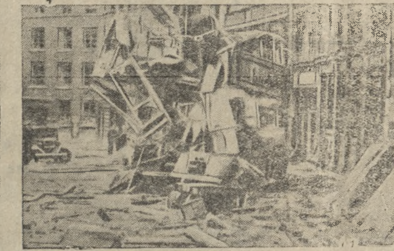
Разрушения на улицах Лондона в результате бомбардировки германской авиацией.

Великая пролетарская революция уничтожила частную собственность на фабрики и заводы, банки и средства сообщения, на воды и леса, на землю и ее нед-