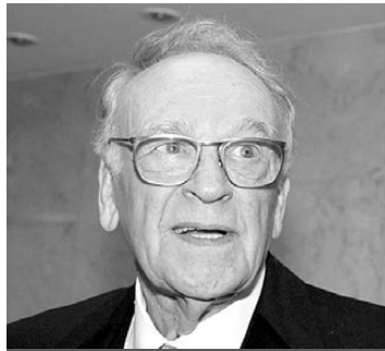
«КАРМАННЫЙ ДОКТОР» вернул меня к жизни!

Счастье - это быть здоровым. Вы согласны? Ибо без здоровья нет сил радоваться жизни. И даже для счастья в личной и семейной жизни и успеха в работе нам непременно нужно здоровье! Как обрести его, знают те, у кого есть «КАРМАННЫЙ ДОКТОР», творящий настоящее волшебство!