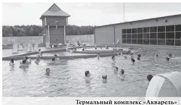
Термальный комплекс «Акварель»

В городе существует ещё одна точка притяжения для гостей региона – термальный комплекс «Акварель». Евгений Куйвашев некоторое время назад посетил эти источники и отметил, что они имеют все шансы, чтобы стать важным звеном в развитии туристического потенциала Свердловской области.