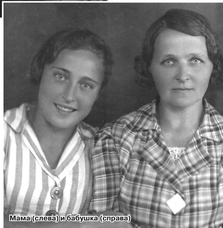
Мама (слева) и бабушка (справа)