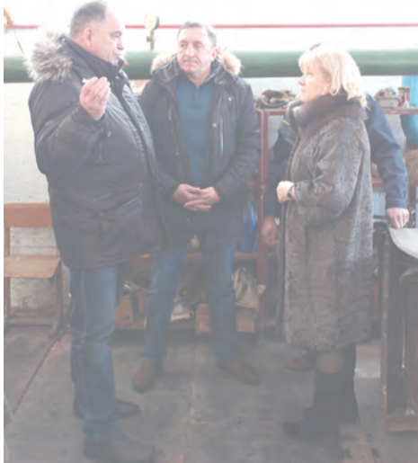
Котельная должна работать в безаварийном режиме