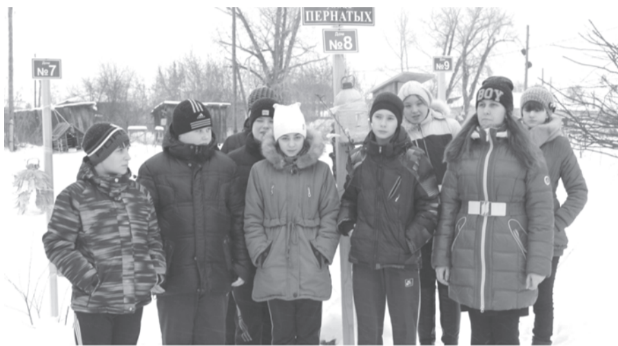
Команда школы № 2