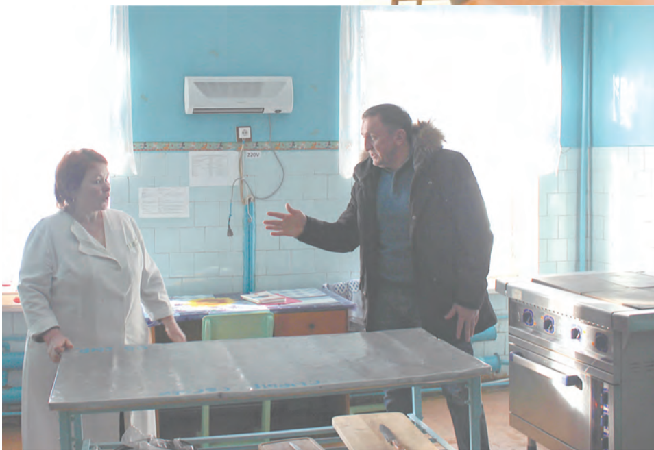
Басмановский д/сад: тепло не должно уходить через щели