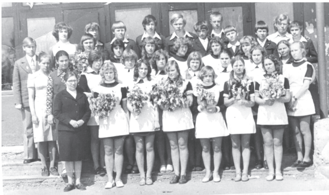
1978 г. Казаковская школа. Кл. руководитель Гостюхина Мария Михайловна.