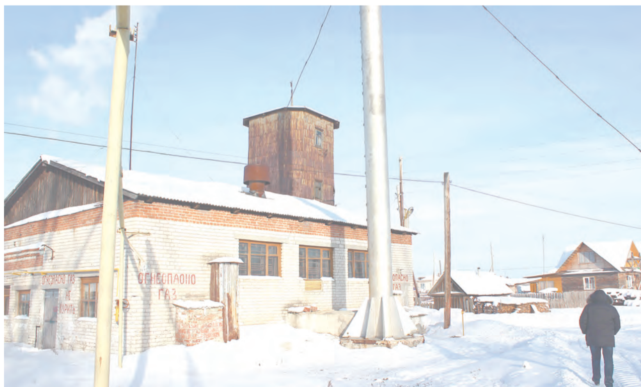
с. Басмановское. Котлы в газовой котельной требуют ремонта