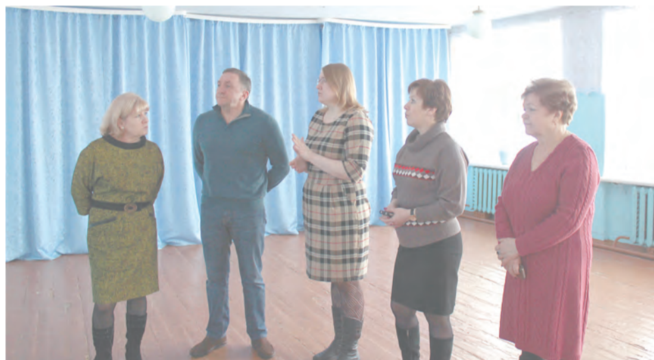
В Казаковской школе