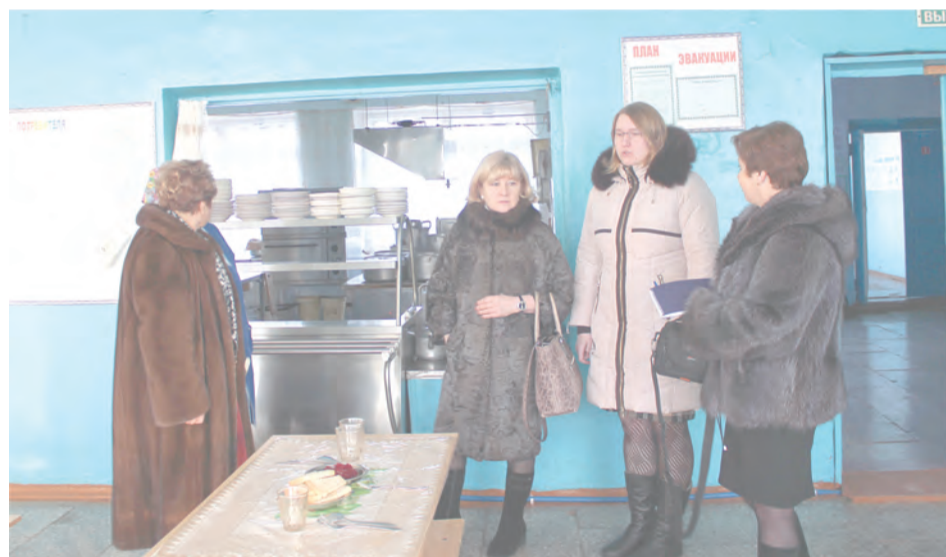
Овощи для обедов выращивают на пришкольном участке