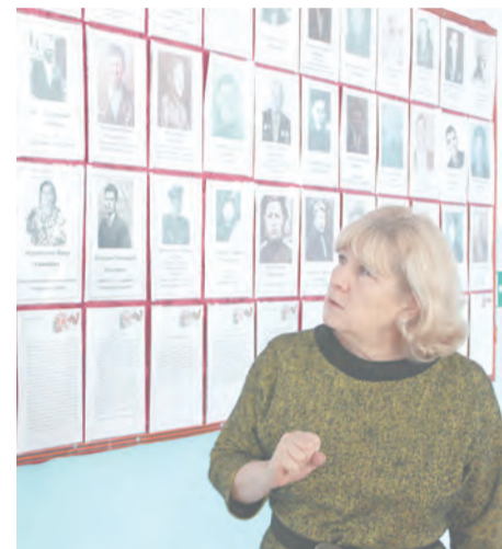
Доска Памяти войнов с. Казаковского

Под впечатлениями едем дальше – в территорию, где проблема уже поставлена в разряд жизненно важных.