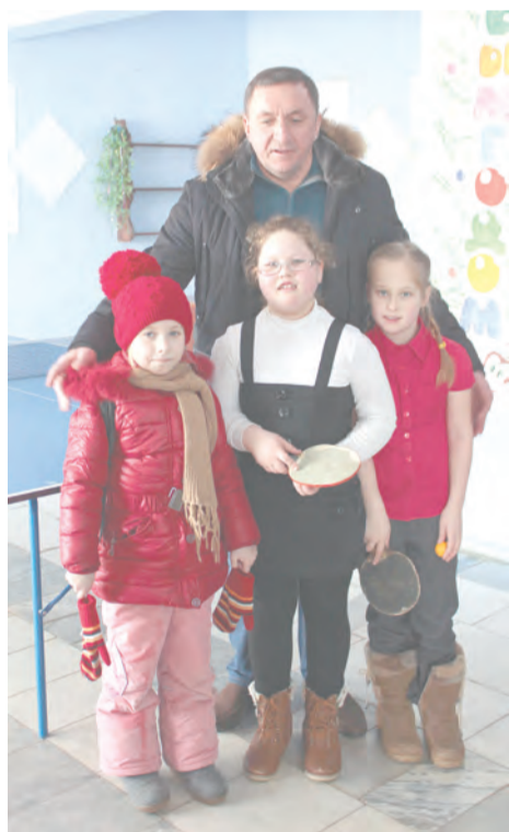
ДК открыт для всех

ли, чтобы протопить ДК, нужно около 300 кубометров дров, т.е. примерно 240 000 рублей на отопительный сезон. Между тем, поставщик тепла - «Энергоресурс» выставляет счета за тепло-энергию в районе 250 тысяч рублей ежемесячно, игнорируя данные приборов учета, которые официально установлены в учреждении. МКУ ТГО «ИКДЦ», не согласившись с позицией поставщика, отказалось оплачивать баснословные деньги и обратилось в федеральную антимонопольную службу с заявлением на действия ресурсной организации, а та, в свою очередь, в арбитражный суд с заявлением на взыскание задолженности. Решение суда поставит точку, и «СН» обязательно вернется к этой теме.