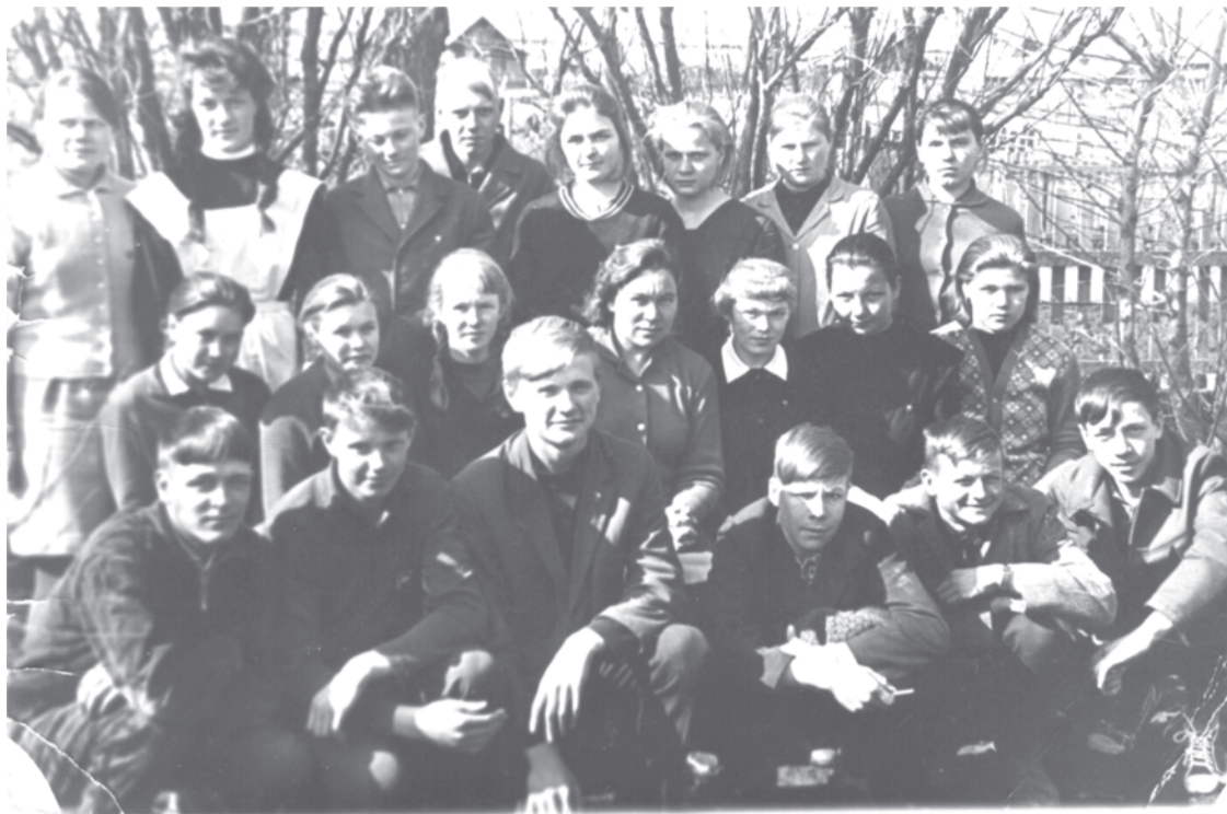
1967 г. Казаковская школа, 8 класс.