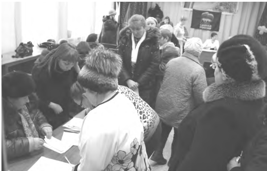
Регистрация делегатов конференции