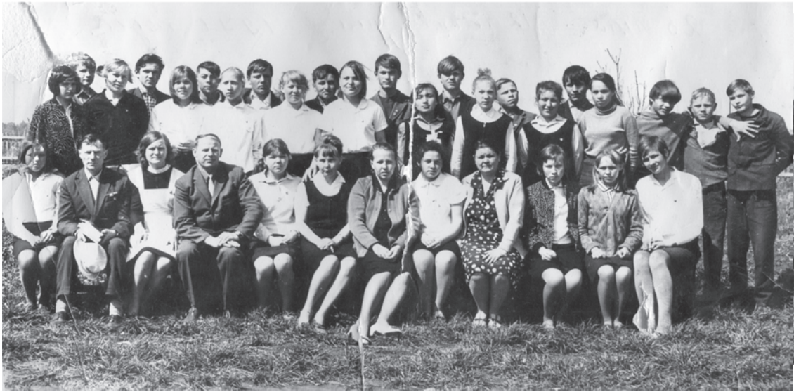
1970 год. Горбуновская школа. 8 класс.