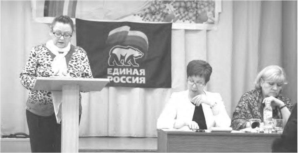
Обсуждение отчетного доклада

выстояли в очередях на прием к педиатрам в душном и тесном коридоре в старом помещении. Сейчас нам не стыдно за детскую консультацию. И эта проблема закрыта на многие годы вперед. А в целом же и в сфере здравоохранения сделано немало. Перечислю лишь значимые события последних лет. Открытие ОВП в п. РТС, и это уже 4-я общеврачебная практика, действующая на нашей территории. Укомплектовано современным оборудованием глазное отделение, которое сегодня принимает пациентов со всего Восточного управленческого округа. По нацпроекту «Здравоохранение» Талицкая ЦРБ приобрела суперсовременный маммограф, а также отремонтировала и укомплектовала новым оборудованием реанимационное и акушерское отделения. Кроме того, проведены ремонты в ФАПах сельских территорий, только в этом году - в Яровском и Комсомольском. Впервые за много лет капитально отремонтирован морг. В местном здравоохранении большая роль отводится профилактической работе. Ежегодно диспансеризацию