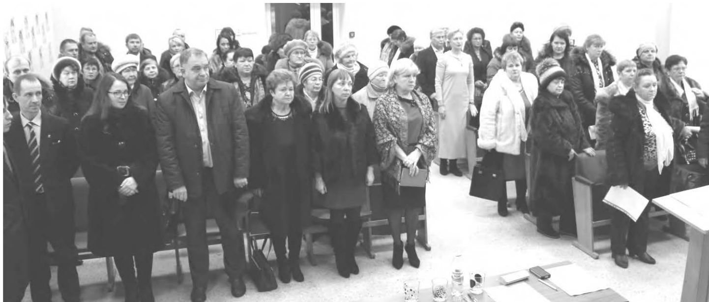
Открытие отчетной конференции Талицкого МО Партии «Единая Россия»