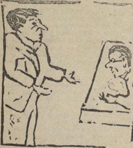
Что вы думаете на счет подсобного хозяйства?