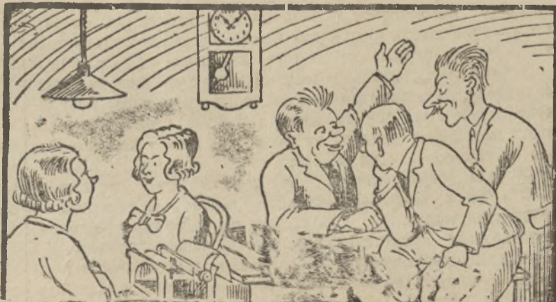
У этих саботажников зернопоставок нашлись смягчающие обстоятельства. Какие? Сердобольный прокурор и мягкий судья.