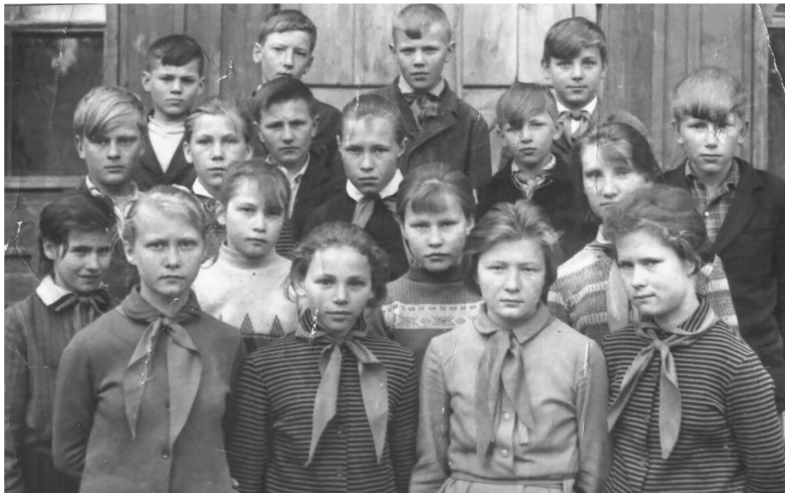
Ученики Чупинской средней школы, 6 «а» класс. 1965 год.