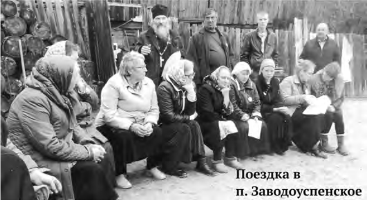
Поездка в п. Заводоуспенское

Общество «Трезвение» при храме святых первоверховных апостолов Петра и Павла продолжает свою работу. Часто нам звонят, приходят к нам, спрашивают, лечим ли мы, кодируем ли... Нет, мы не лечим и не кодируем, у нас трезвенное просвещение, мы учимся сами и распространяем информацию. Мы