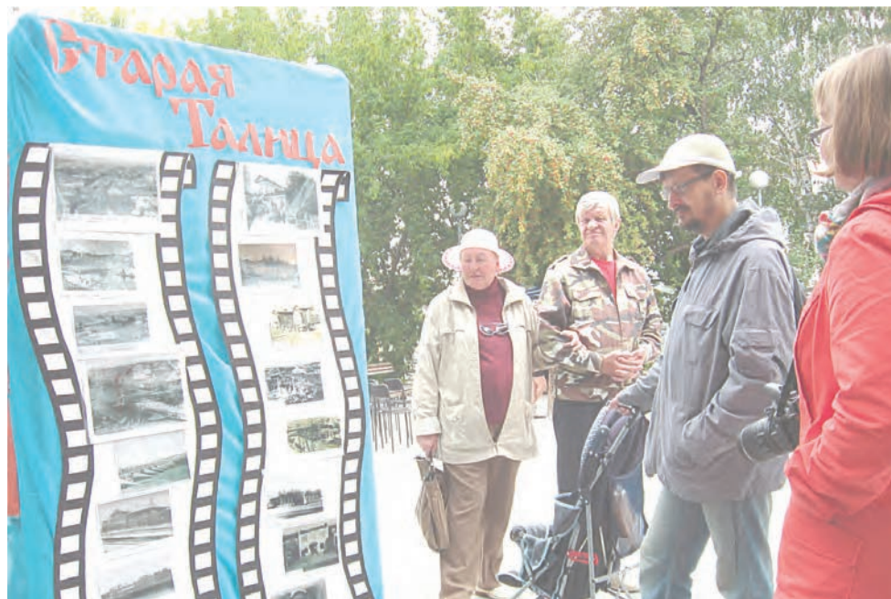
Выставка в сквере Н. И. Кузнецова

Благодаря выигранному гранту в размере 258 200 рублей, появится возможность