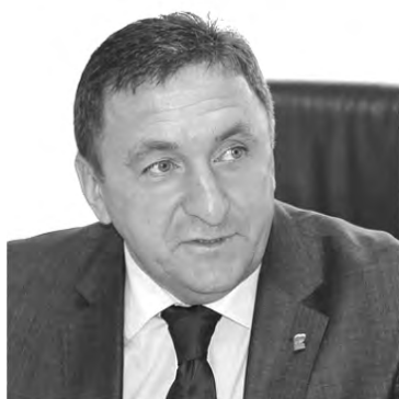
Комментирует Александр Толкачев, глава Талицкого городского округа:

Жители благоустроенных домов центральной части Талицы, отапливаемые от бывшей котельной БХЗ, обратились в редакцию газеты с жалобой о том, что в отопительный сезон в квартирах не соблюдается температурный режим и до сих пор отсутствует горячее водоснабжение.