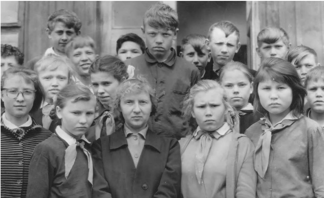
Ученики Чупинской средней школы, 6 «б» класс. 1965 год.