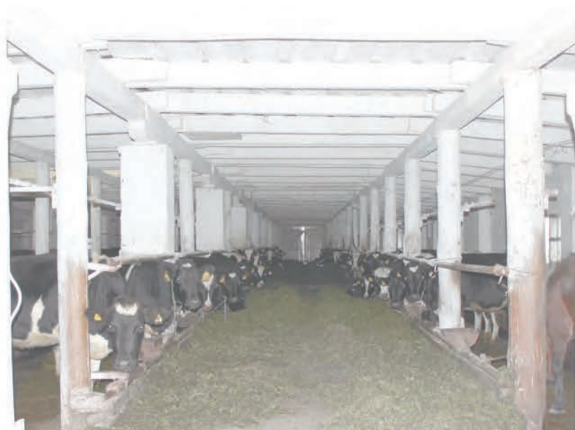
Такие фермы должны остаться в прошлом.

Под его непосредственным контролем находятся вопросы развития социальной сферы, реализация приоритетных нацпроектов и демографической политики, баланс трудовых ресурсов, господдержка некоммерческих организаций, создание особых экономических зон на территории области.