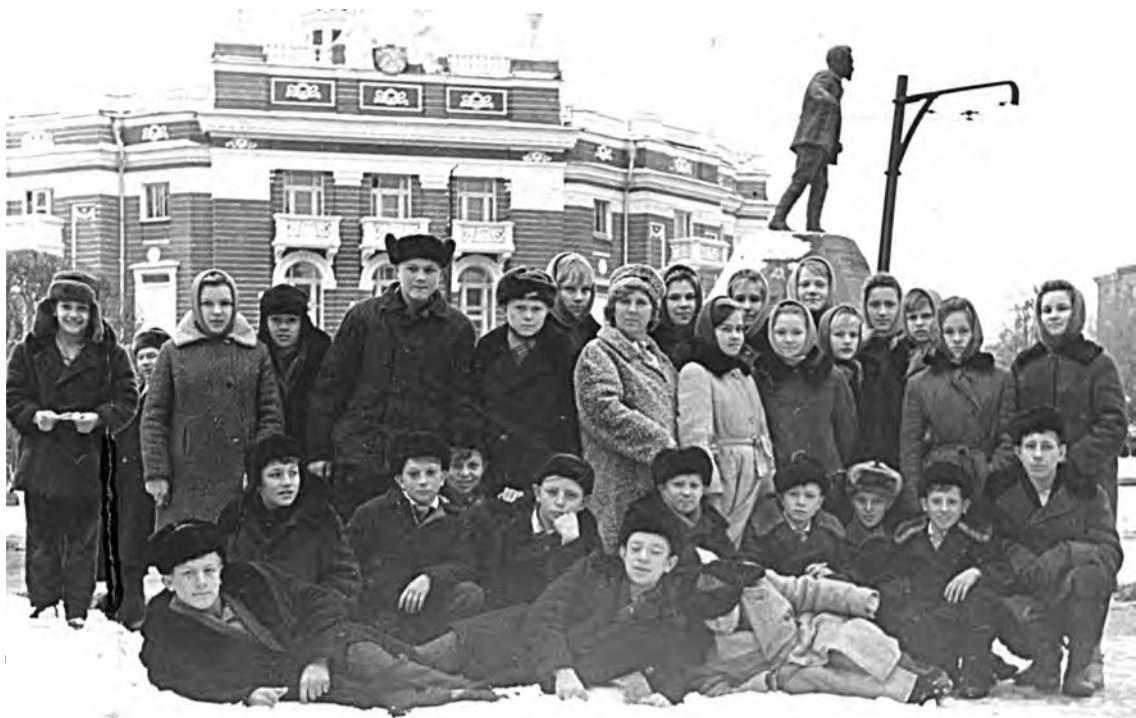
Этот снимок сделан 13 ноября 1966 года - «Туристическая поездка в г. Свердловск» (ныне Екатеринбург).

Это была не просто поездка, а награда за учебу и активное участие в школьных мероприятиях. На