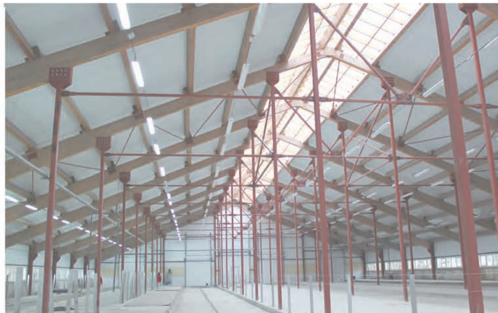
Будущее молочного животноводства