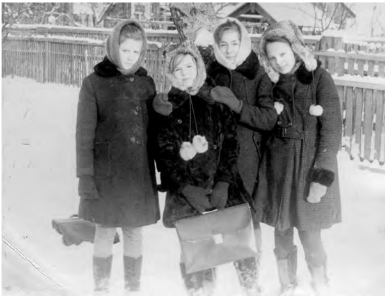
После уроков... 6-а класс. 1975 г. Троицкая школа № 5.

Присылайте фото на конкурс по адресу редакции: Талица, Ленина, 88, редакция газеты «Сельская новь», фотоконкурс «Одноклассники». Снимки принимаются и по электронной почте редакции gazeta-sn@mail.ru.