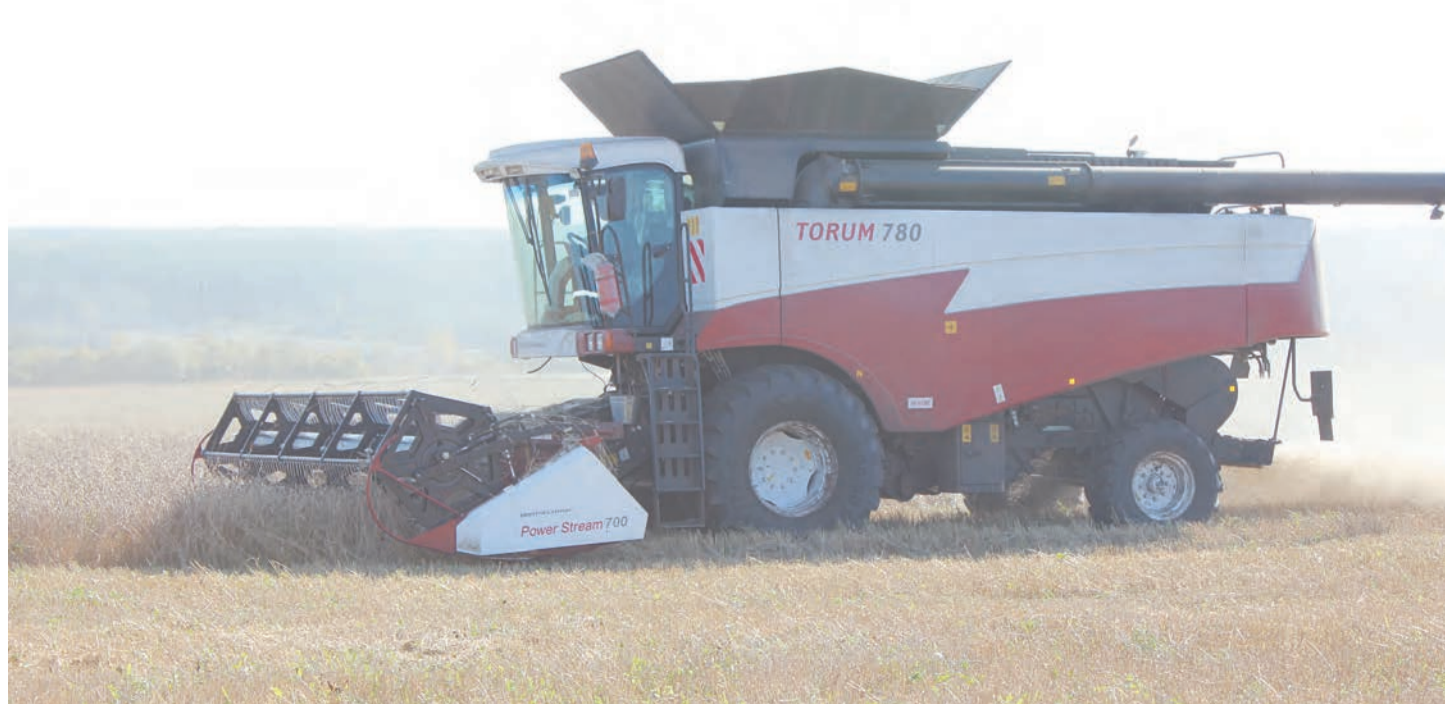
Новый комбайн «Торум 780»

Как рассказали в министерстве АПК и продовольствия Свердловской области в регионе зерновые и зернобобовые культуры убраны на 40,4 процентах посевных площадей, что превышает уровень прошлого года на 15 процентов. Валовый сбор зерна составил 280,5 тысячи тонн в первоначальном виде, что превышает прошлогодний уровень на 30 процентов. Несмотря на сложные погодные условия темпы уборки зерновых выше, чем в прошлом году.