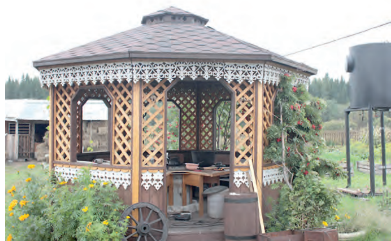
Рукотворная беседка во дворе

запаха на насыщенный цветочно-фруктовый. И завершающий этап – сушка: ферментированные листья мелко режут, расстилают на противнях, застеленных пергаментом, слоем в 1-1,5 сантиметра и сушат в духовке около часа, периодически проверяя готовность на ощупь. Хорошо просушенный чай имеет цвет черного настоящего чая. В общем от сбора до готового чая проходит три-четыре дня. А хранят иван-чай в сухом месте, в стеклянных банках, накрытых марлей.