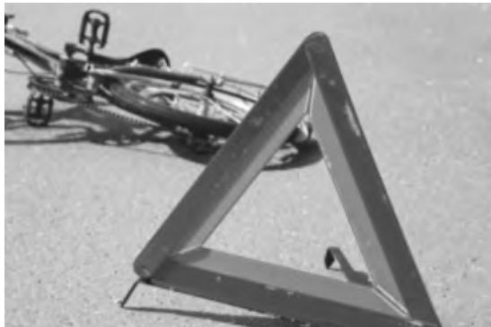
На минувшей неделе в ДТП пострадал 18-летний мотоциклист

Авария произошла 29 июля по ул.Ленина, в пос.Троицком. Водитель автомобиля «ВАЗ» при повороте налево не убедился в безопасности маневра и не предоставил преимущества в движении водителю мотоцикла. В результате столкновения молодой человек, управляющий мотоциклом и имеющий стаж вождения один год, получил ушиб ноги. Сейчас он находится на амбулаторном лечении.