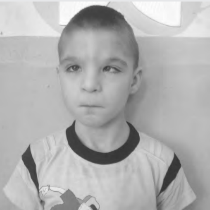
Мальчик, 8 лет.

Очень активный, подвижный ребёнок, предпочитает играть один, перекладывает кубики, раскладывает книги.