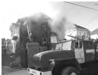
В 09:03, 3 августа, на пульт диспетчера 86 пожарной части поступило сообщение о пожаре. Во дворе жилого дома горел грузовой автомобиль «Газель». Своими

силами жители смогли отбуксировать автомобиль в переулок Леспромхоза.