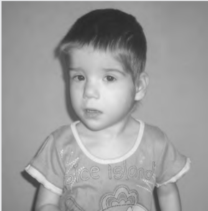
Девочка, 3 года.

Познакомлюсь с женщиной до 55 лет для серьезных отношений. Тел.: 2-24-89 .