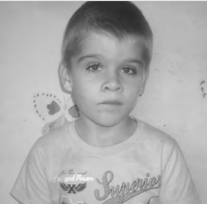
Мальчик, 5 лет.

Очень подвижная девочка, легко идет на контакт со взрослыми, очень нуждается в ласке. Увлекается игрой в мозаику и любит собирать конструктор.