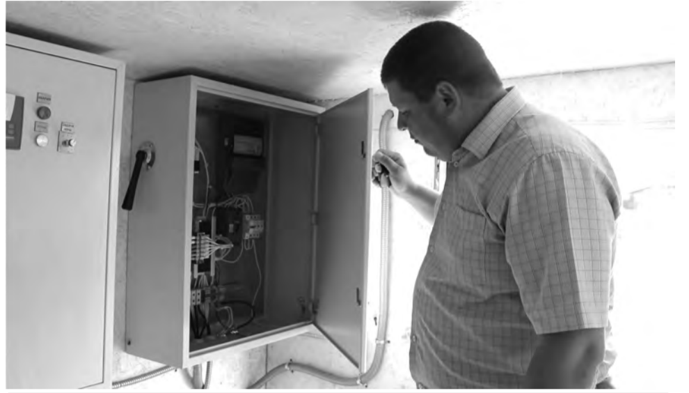
Стоимость одного кубического метра за воду с 1 июля составит 11,34.