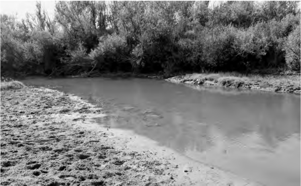
Воды здесь по колено, кажется, негде утонуть...