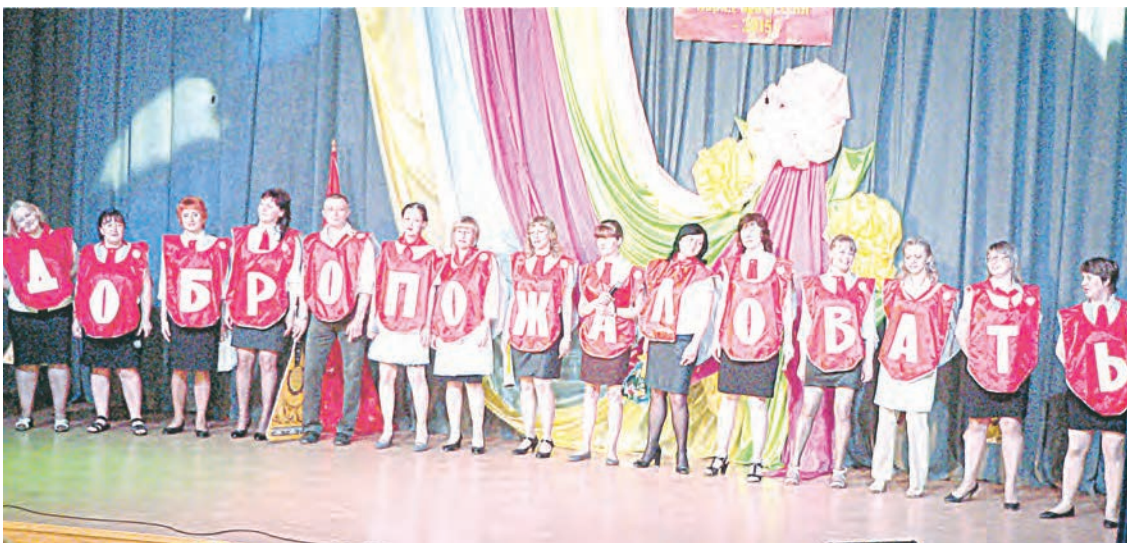
«Сердечный санаторий» приглашает...