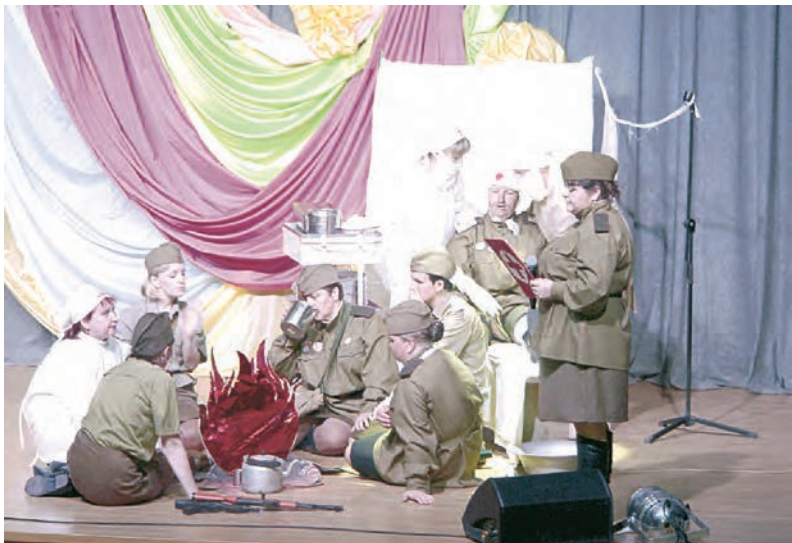
Фронтовой госпиталь - сколько он вернул в строй (команда ЦРБ)