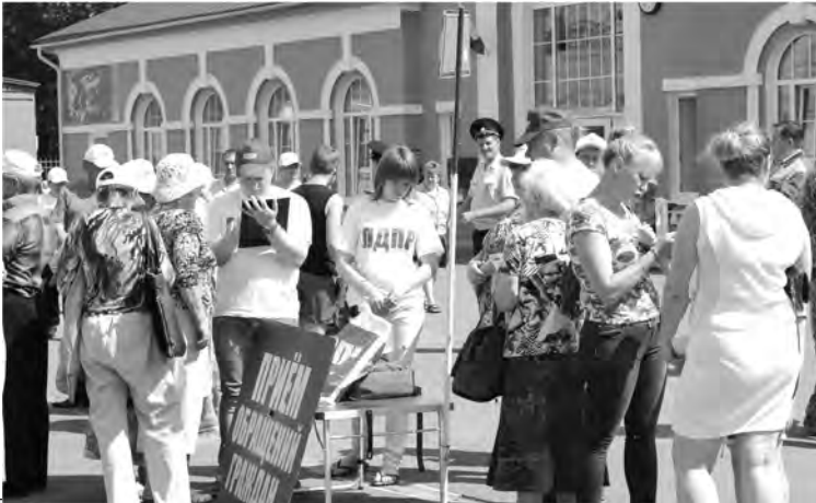
Агитпоезд ЛДПР стартовал из Москвы 22 мая, а вернется лишь 11 июня. В программе путешествия 9 регионов и более 300 остановок-встреч с местными жителями. Главная задача команды ЛДПР – сбор жалоб и наказов избирателей.

подкатил агитпоезд, состоящий из более чем 20 вагонов. О том, что в поезде нет самого Жириновского, не афишировали, похоже, побоявшись, что народ и вовсе не соберется. И сей факт вызвал большое разочарование. Хотели посмотреть на самого Жириновского, удостовериться, так сказать, что он все еще живой, а пришлось слушать депутатов Госдумы каких-то там регионов, которых мы не то что в глаза не видели, а даже и не слышали их имена. Говорили, как по заученному – о коррупции, о защите малого и среднего бизнеса, о высоких тарифах на услуги ЖКХ и газ, рассказали всю «правду» о деле «Оборонсервиса», Сердюкове и блондинке Васильевой, о плохих дорогах и аварийном жилье, о том, что Крым наш... Действующие депутаты Госдумы от ЛДПР обличали и обличали, но так и не сказали, каких результатов они добились, как защитили электорат от антинародных законов, чиновников-коррупционеров, что сделали для своих регионов, сидя в мягких креслах в Москве. А это очень хотелось бы услышать, потому что агитационных обещаний мы нае-