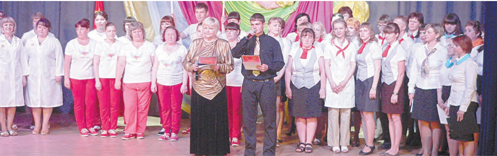
Все команды на сцене, к Параду профессий - готовы!

Воскресенье, 7 июня, РИКДЦ «Юбилейный». Сюда на районный смотр-конкурс творческих трудовых коллективов «ПАРАД ПРОФЕССИЙ-2015», который проходит под девизом «СЛАВИМ ЧЕЛОВЕКА ТРУДА», прибыли четыре команды.