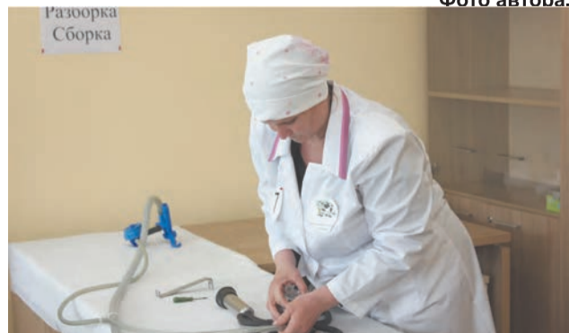
Сборка-разборка доильного аппарата