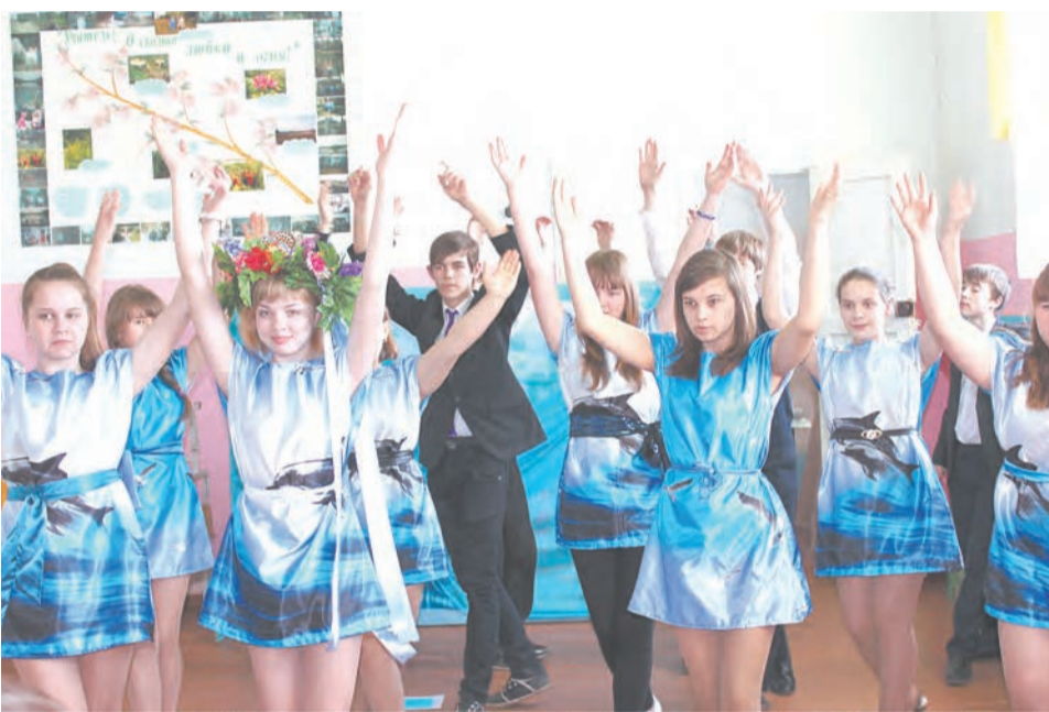
Талицкая основная общеобразовательная школа № 2

Театрализованные представления школ в этом году отличались яркостью, четкостью, содержательностью и актуальностью. Практически во всех выступлениях прозвучала суть природоохранной деятельности школы, все мероприятия и экологические акции, проводимые в образовательном учреждении.