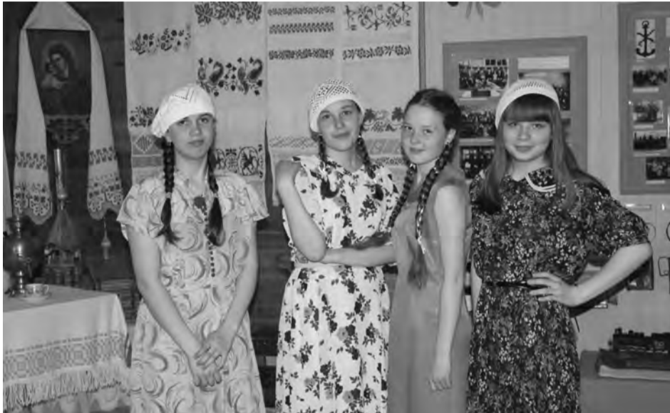
Девушки в подлинных платьях 40-50-х годов

Наряды, как хранители исторических традиций, были отправной точкой для совершения прыжка во времени.