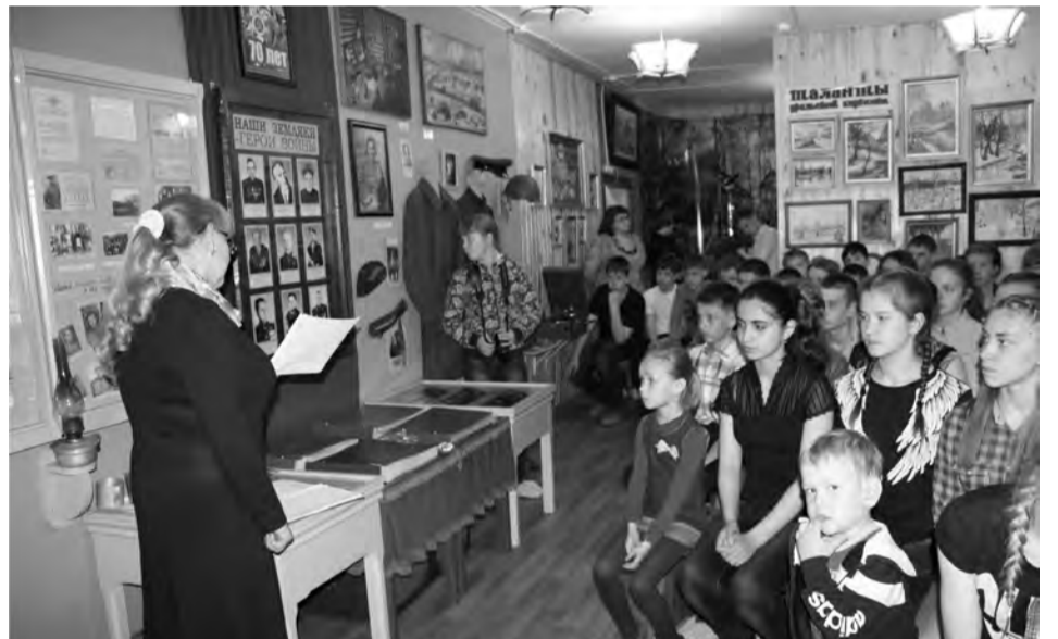
Звучат воспоминания фронтовиков