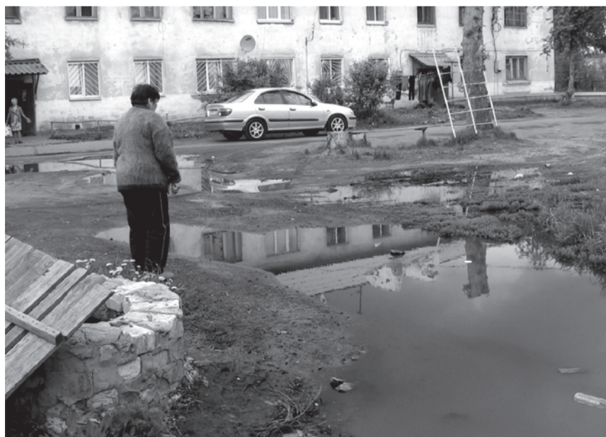
Дышать нечем. Детям играть негде.