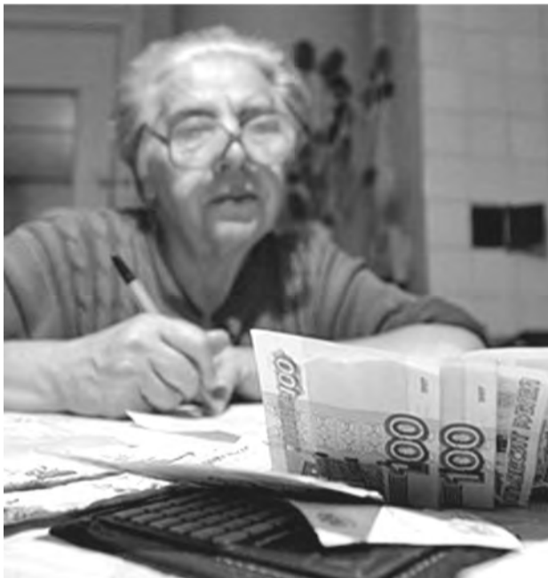
Компенсация обозначает возмещение потерь, понесенных убытков, расходов.

5) документа о неполучении мер социальной поддержки по оплате жилого помещения и коммунальных услуг по месту жительства (в случае обращения за назначением компенсации расходов по месту пребывания).