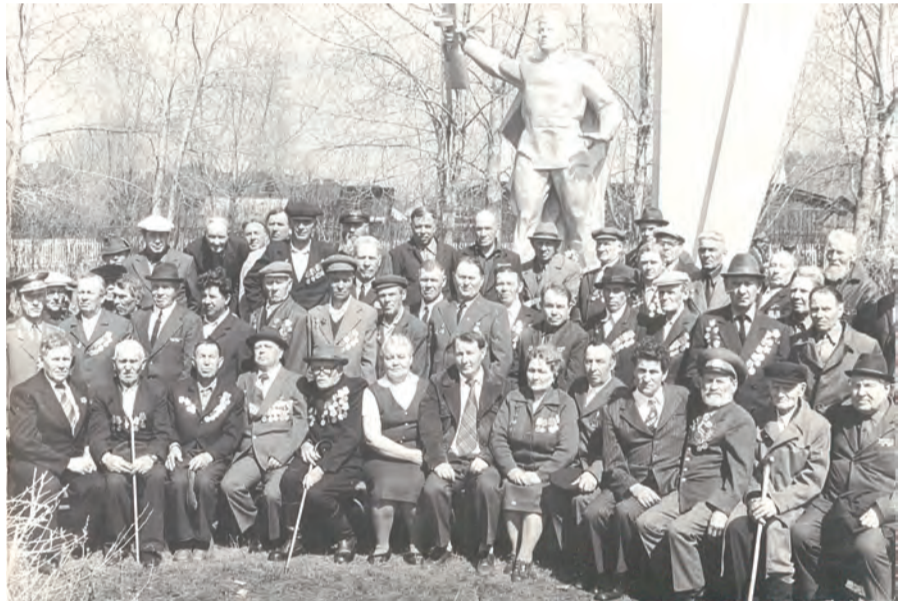
Ветераны Великой Отечественной войны у обелиска. 1982 год.