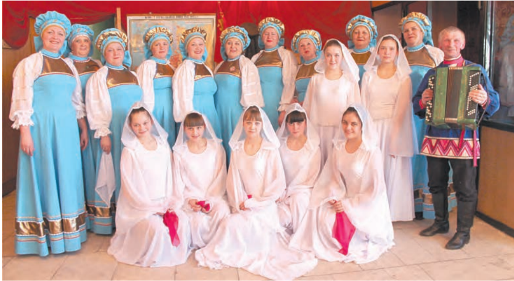
Ансамбль песни и танца «Россияночка»

4 апреля 2015 года проведен I отборочный тур VII областного фестиваля художественной самодеятельности предприятий и организаций АПК Свердловской области «ВЕСНА НАДЕЖД» под девизом «Это гордое слово – Победа».