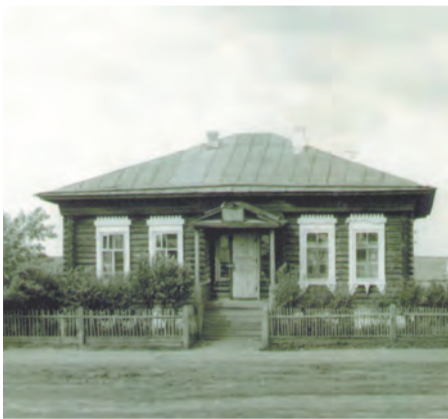
Старое здание школы

Наш класс казался нам лучшим на свете местом