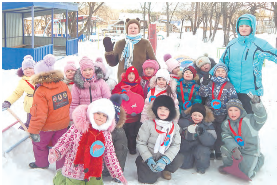
Малые олимпийские игры в детском саду «Теремок»

«На территории Мохирёвской управы «Лыжня России» проходила на базе Беляковской школы, - написала нам Т. Третьякова. - Набралось более 70