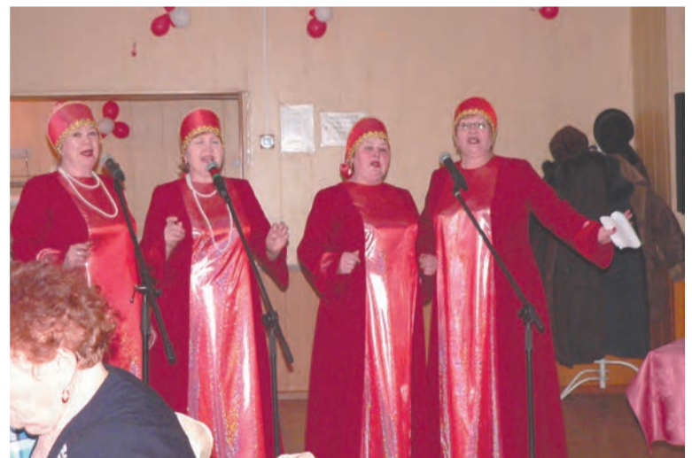
Ансамбль «Желанушки» стал, действительно, желанным...