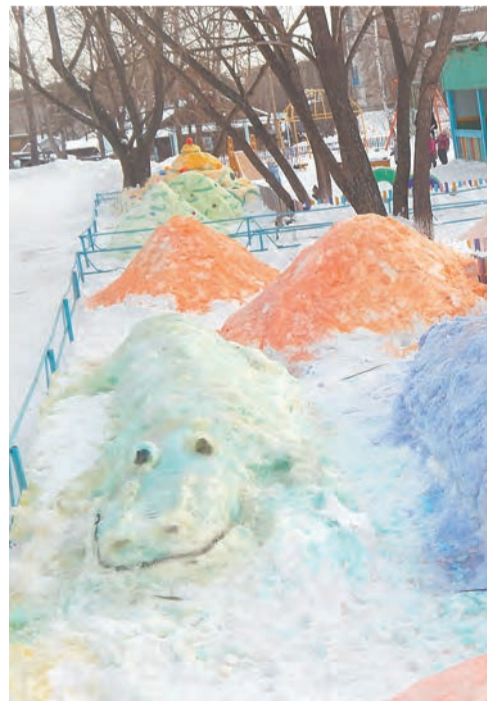
Зимнее оформление участков в д/с «Теремок»