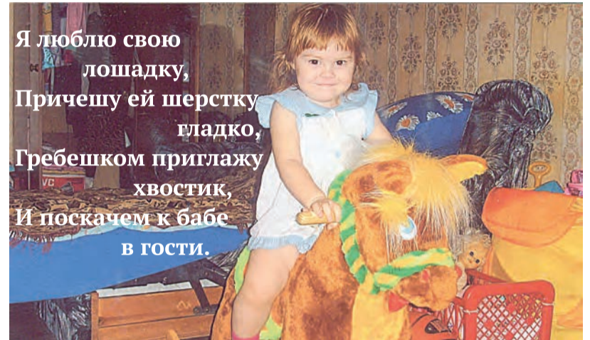
Я люблю свою лошадку, Причешу ей шерстку гладко, Гребешком приглажу хвостик, И поскачем к бабе в гости.