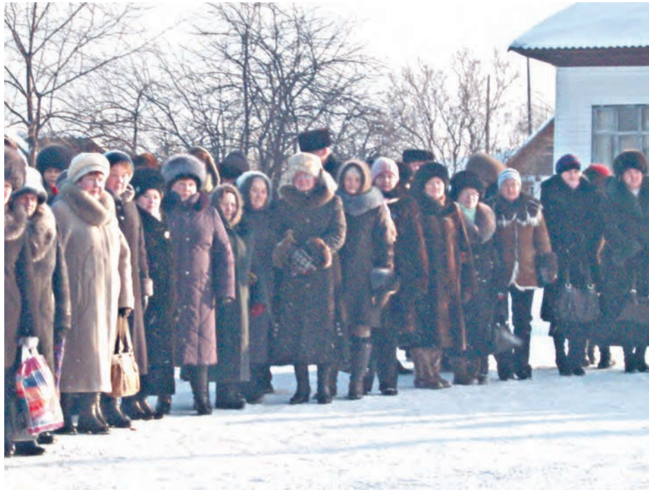
Митинг, посвященный дню рождения Б. Н. Ельцина. Буткинская управа. 2011 г.

«Разнообразные вопросы жизни района затрагивают наши читатели в своих письмах в редакцию. Члены-пайщики Мохиревского сельпо, тт.Тегенцева, Змановский,