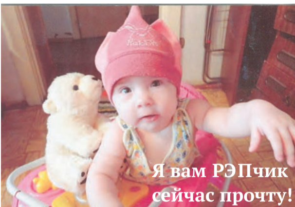
Я вам РЭПчик сейчас прочту!