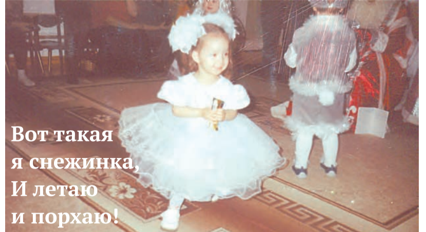
Вот такая я снежинка, И летаю и порхаю!