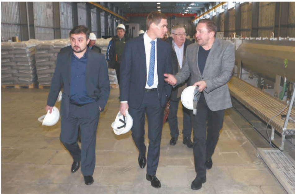
На производственной площадке ЗАО «Техстрой»

«Моя мечта — подтянуть уровень жизни в муниципалитетах, запустить активность в местный бизнес, который бывает инертным...» - министр международных и внешнеэкономических связей Свердловской области Андрей Соболев.