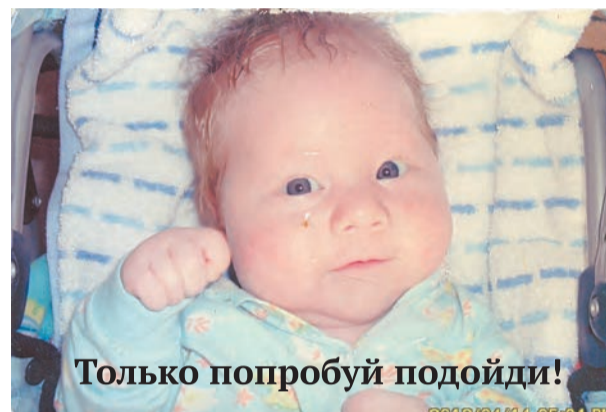
Только попробуй подойди!