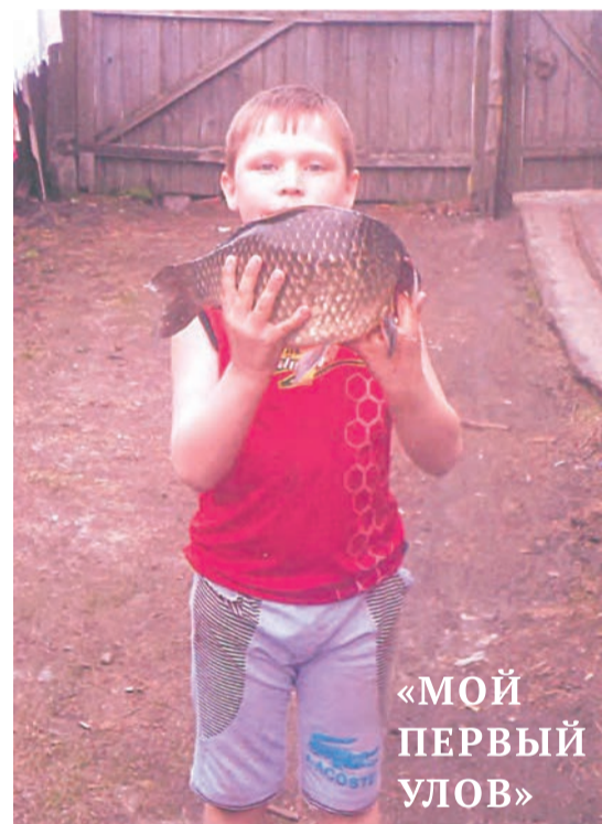
«МОЙ ПЕРВЫЙ УЛОВ»