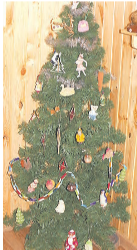
Ёлочка, украшенная игрушками из прошлого века

палочек. Все эти игрушки также представлены на нашей ретро-ёлочке.