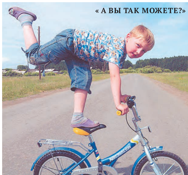
« А ВЫ ТАК МОЖЕТЕ? »