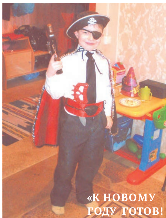
«К НОВОМУ ГОДУ ГОТОВ!»