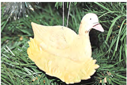
Игрушка 30-х годов двадцатого века

В начале 1950-х изготавливалось много игрушек в виде фруктов, ягод и овощей (разумеется, несъедобных). Появились и сказочные персонажи: Айболит, Дед Мороз, Снегурочка, Чиполлино, различные звери: белочки, медведи, зайцы. Тогда же, в 50-х, появилась мода на стеклянные бусы и композиции из стеклянных шариков, бус и