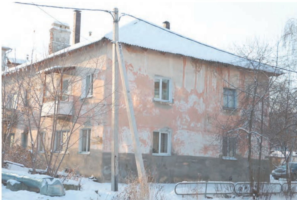
г. Талица, ул. Пушкина, 2-А. Капремонт этого дома назначен на 2015 год. Отремонтированы будут инженерные коммуникации, кровля, подвал и другие места общего пользования.

Уважаемые жители Талицкого городского округа!