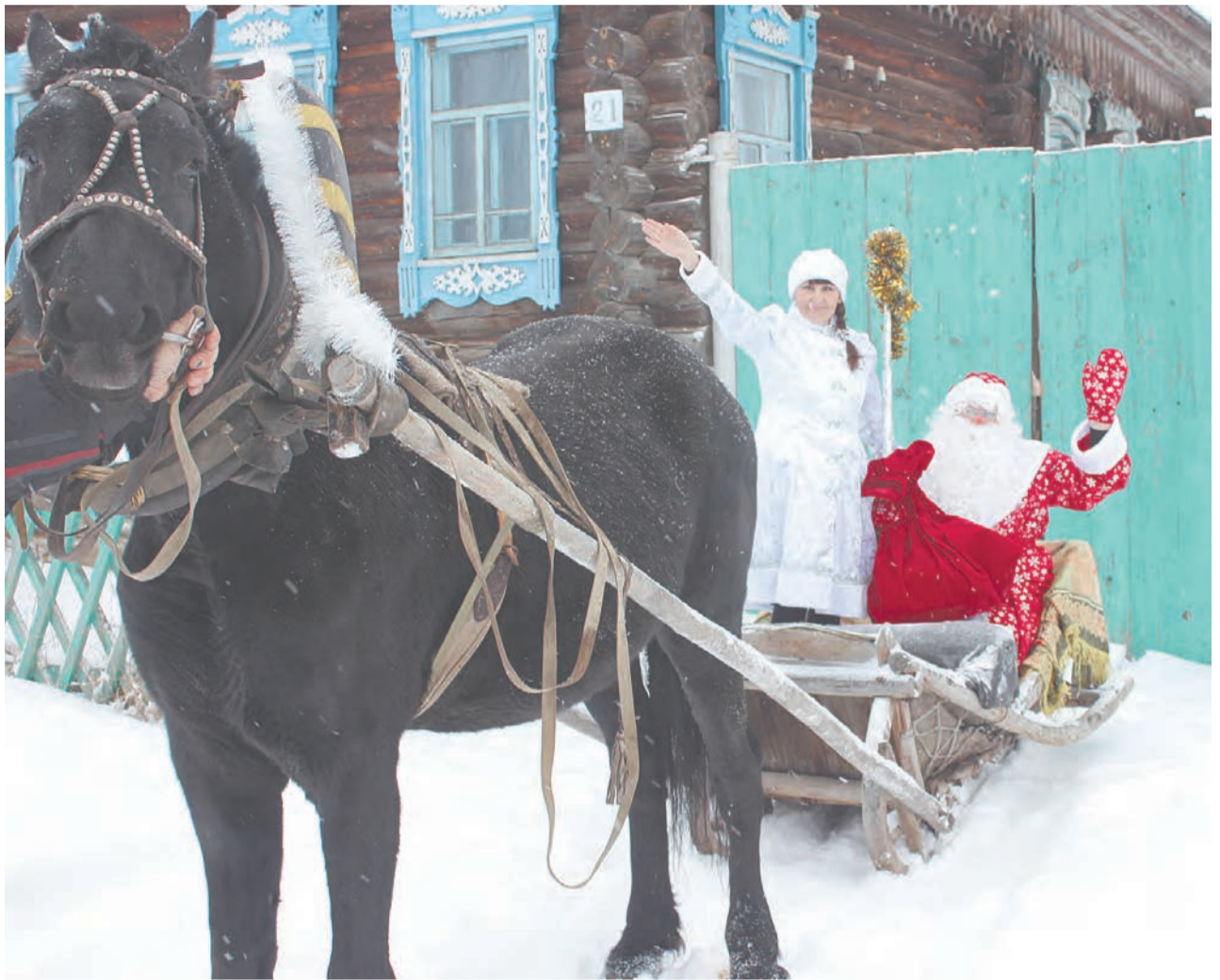
Мохирёвские Дед Мороз и Снегурочка желают всем счастья в Новом году