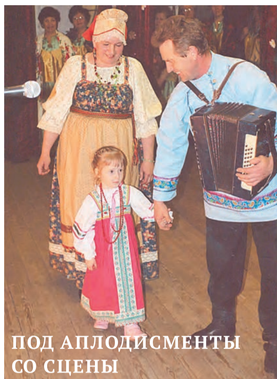
ПОД АПЛОДИСМЕНТЫ СО СЦЕНЫ