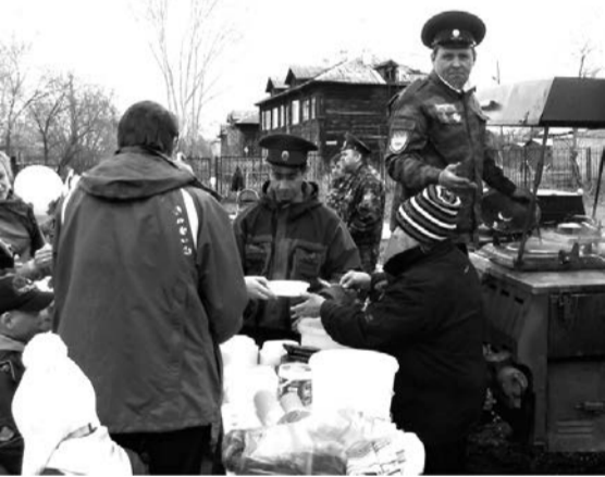
В завершение праздника всех накормили «фронтной кашей»