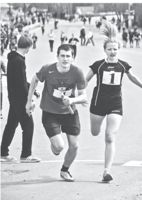
Передача эстафетной палочки