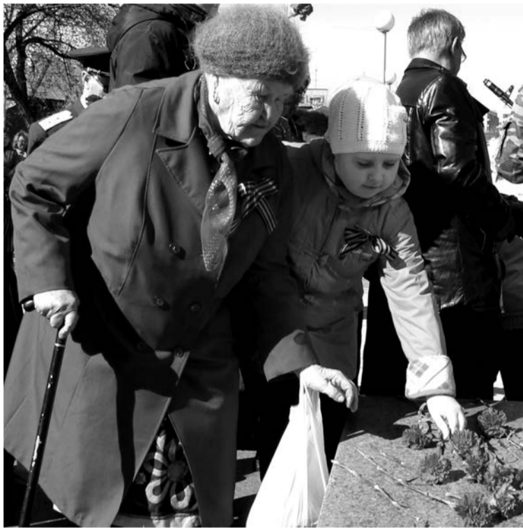
Цветы моему воевавшему прадеду