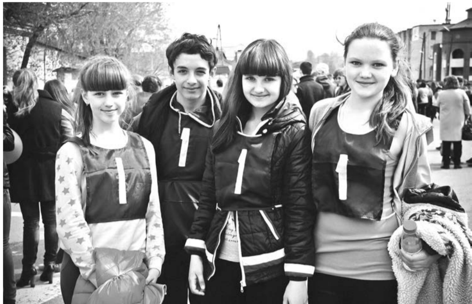
Легкоатлеты Taliцкой школы №1

В этом году эстафета на приз газеты «Сельская новь» стала очень патриотичной, потому что прошла на следующий день после празднования Дня Великой Победы