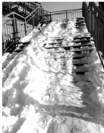
Люди падали с железнодорожного моста, пробираясь утром на работу

24 апреля я рискнула отправиться в стальной уральский град на своей «ласточке». И туда и обратно ехала в снегопад. Непредвиденные обстоятельства заставили меня и на завтра таким же способом вновь добираться до Екатеринбурга. Сделав все необходимое и с пожеланием от коллег ангела в дорогу в такую непогоду, я отправилась обратно. И тут же поняла, что в помощь мне нужны не только ангелы, но и Сам Бог! Видимость на трассе была нулевая. Машины продвигались со скоростью 20 километров в час. С Божьей помощью добралась до границы Богдановичского и Камышловского района, всю дорогу молясь. На каждом километре пути справа и