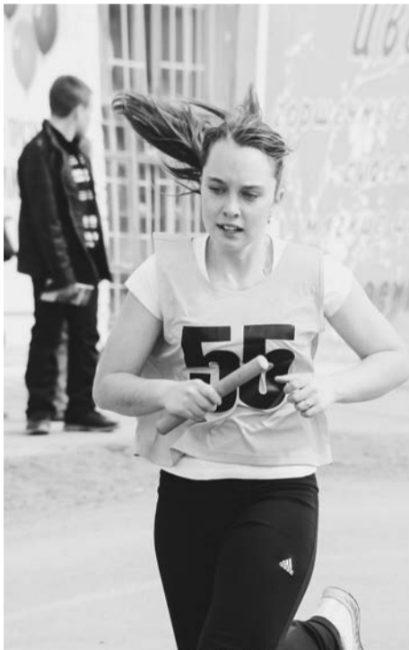
Участница эстафеты из школы №55

Легкоатлетическая эстафета стартовала от площади до талицкой ЦРБ и обратно к площади. Всего 12 этапов, все различной дистанции до 1000 метров. Команды-победители и призеры награждены кубками, медалями, дипломами. Стоит отметить, что Совет ветеранов Афганистана в этом году 21 раз дарит победителям спонсорские призы, его организаторы всегда поддерживают массовые спортивные мероприятия и активную позицию молодежи. Поздравляем победителей! Назовем «золотых» победителей нынешней