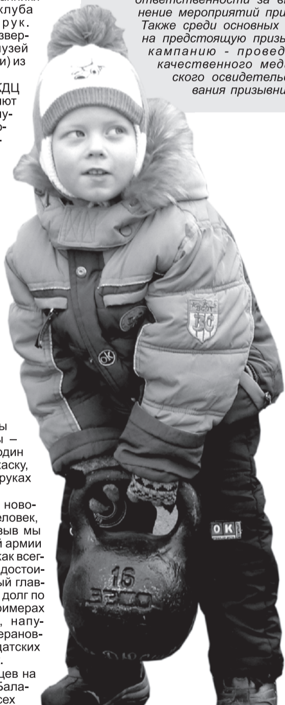
- Папа, у меня получилось!

В Свердловской области должно быть обеспечено качественное и своевременное проведение призывной кампании. Для этого требуется скоординировать усилия всех структур, предусмотреть систему контроля и ответственности за выполнение мероприятий призыва. Также среди основных задач на предстоящую призывную кампанию - проведение качественного медицинского освидетельствования призывников и