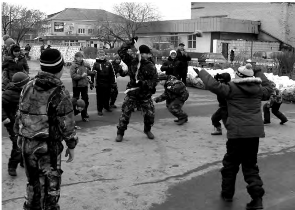
Игры с подростками проводит руководитель клуба «Кречет» (г.Тюмень)

подготовка юношей по военным специальностям.