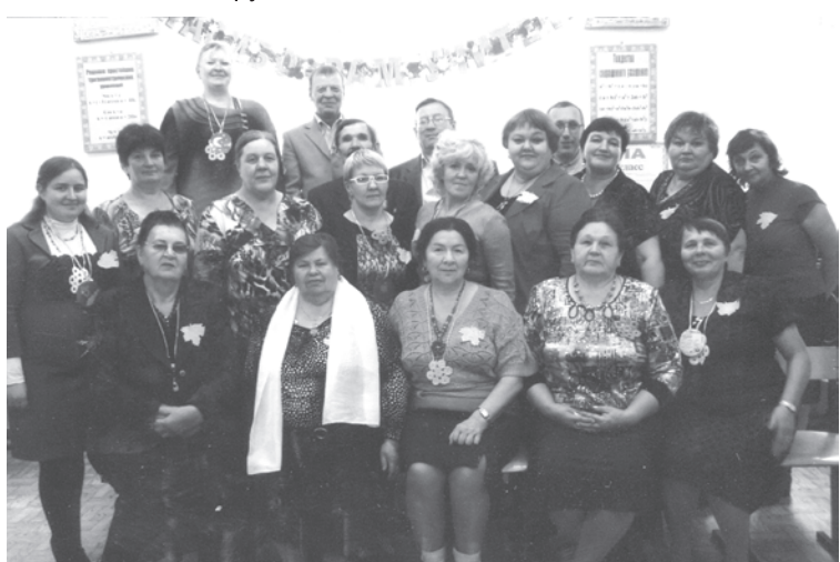
Ветераны педагогического труда