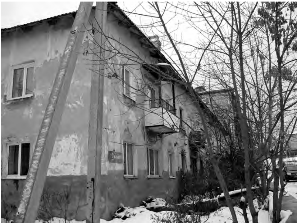
Давно ждёт ремонта дом по ул. Пушкина, 2-а.