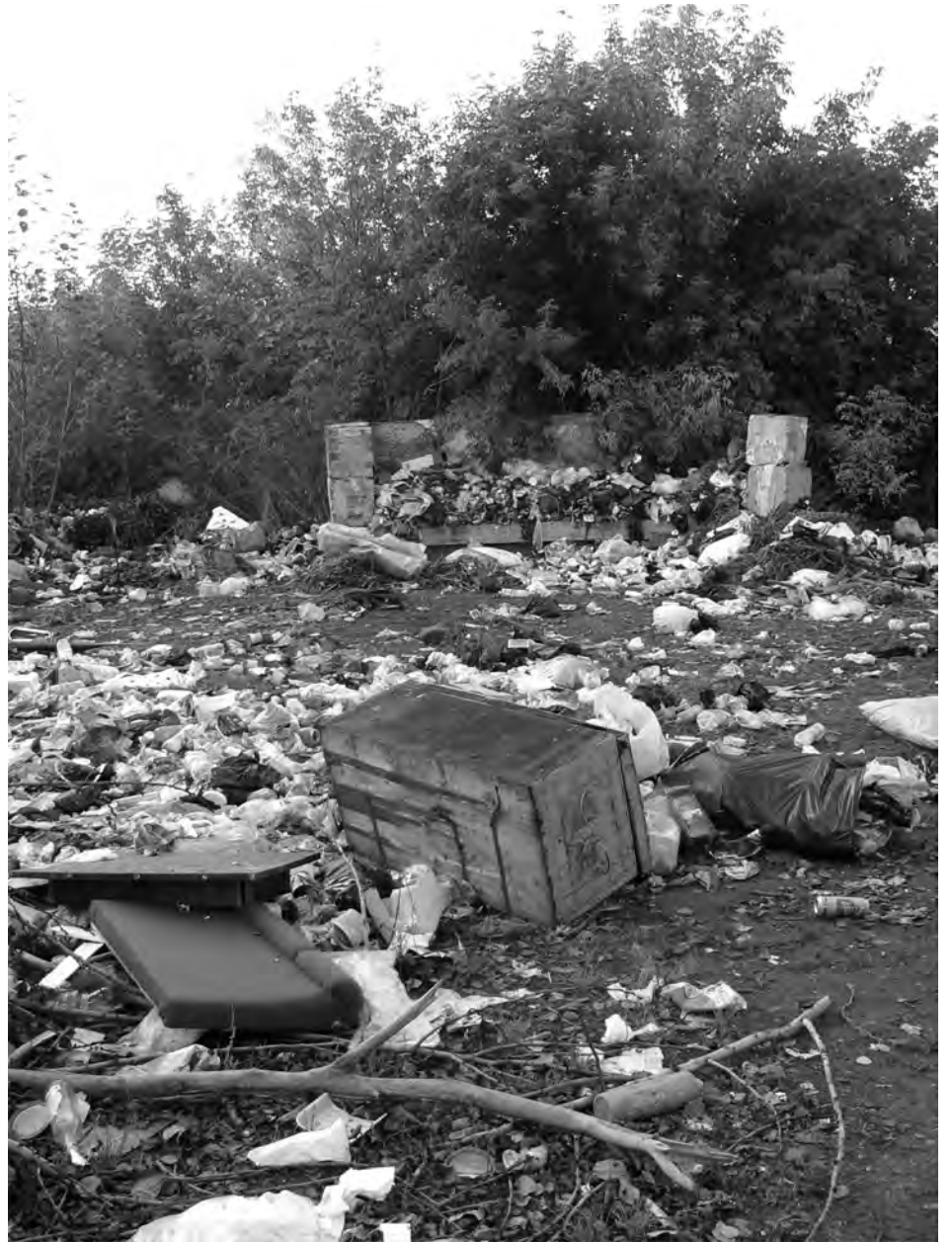
Несанкционированная свалка на ул. Советской, 13!