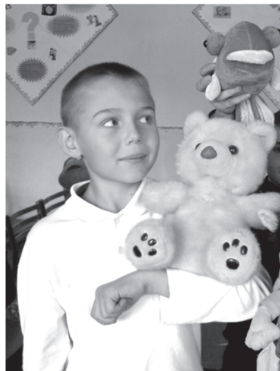
Один из моментов конкурса

Только один день, 7 ОКТЯБРЯ На территории бывшего вещевого рынка г.Талицы