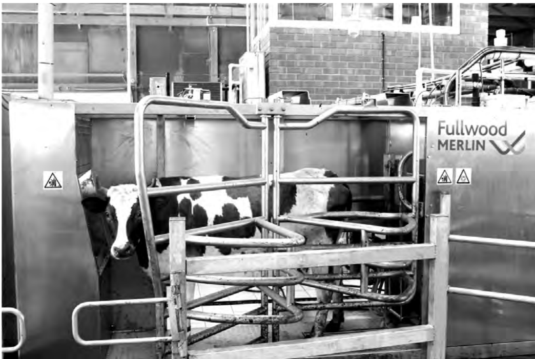
Так выглядит доильный робот

Благодаря увеличению числа доек вырастает продуктивность животных, а уменьшение интервалов времени между дойками улучшает состояние коров: