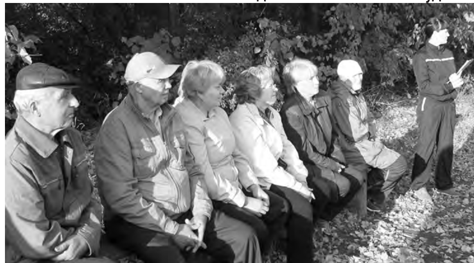
24 сентября. Первый сход жителей.