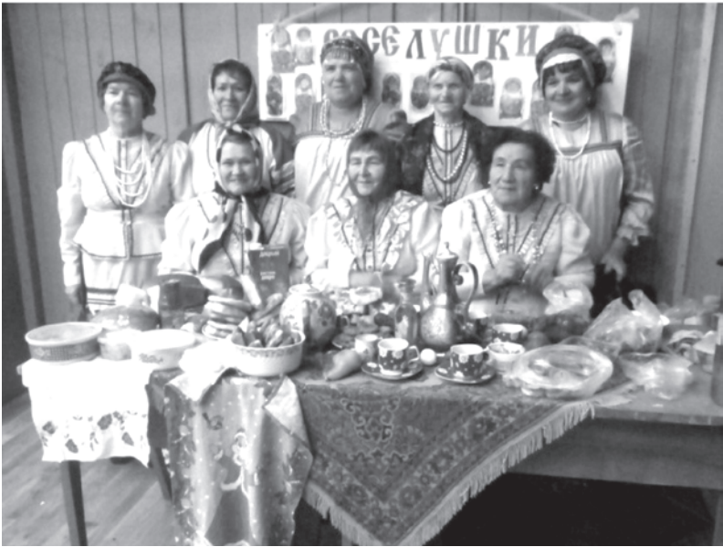
Фольклорный ансамбль «Веселушки» пос. Пионерский.

Кстати. Яков Силин отметил, что Свердловская область – один из богатейших по национальному составу регионов России: «У нас в мире и согласии проживают люди 160 национальностей, благодаря тому, что в сфере межнациональных отношений проводится последовательная работа, направленная на воспитание культуры