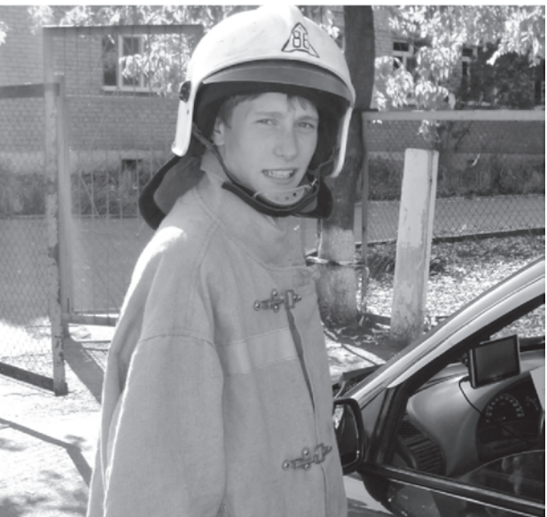
Юный помощник пожарных