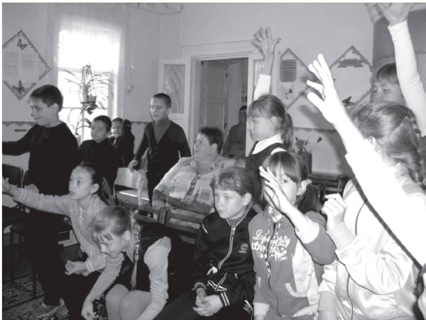
В центре каждый может выбрать себе занятие по душе

Кроме развлекательных мероприятий на празднике были и серьезные моменты – например, ведущие презентовали ребятам все детские творческие объединения, работающие в Экологическом центре, рассказали, чем интересным можно заняться в каждом из них. В центре большой выбор детских творческих объединений. Здесь каждый может выбрать себе занятие по душе: делать прекрас-