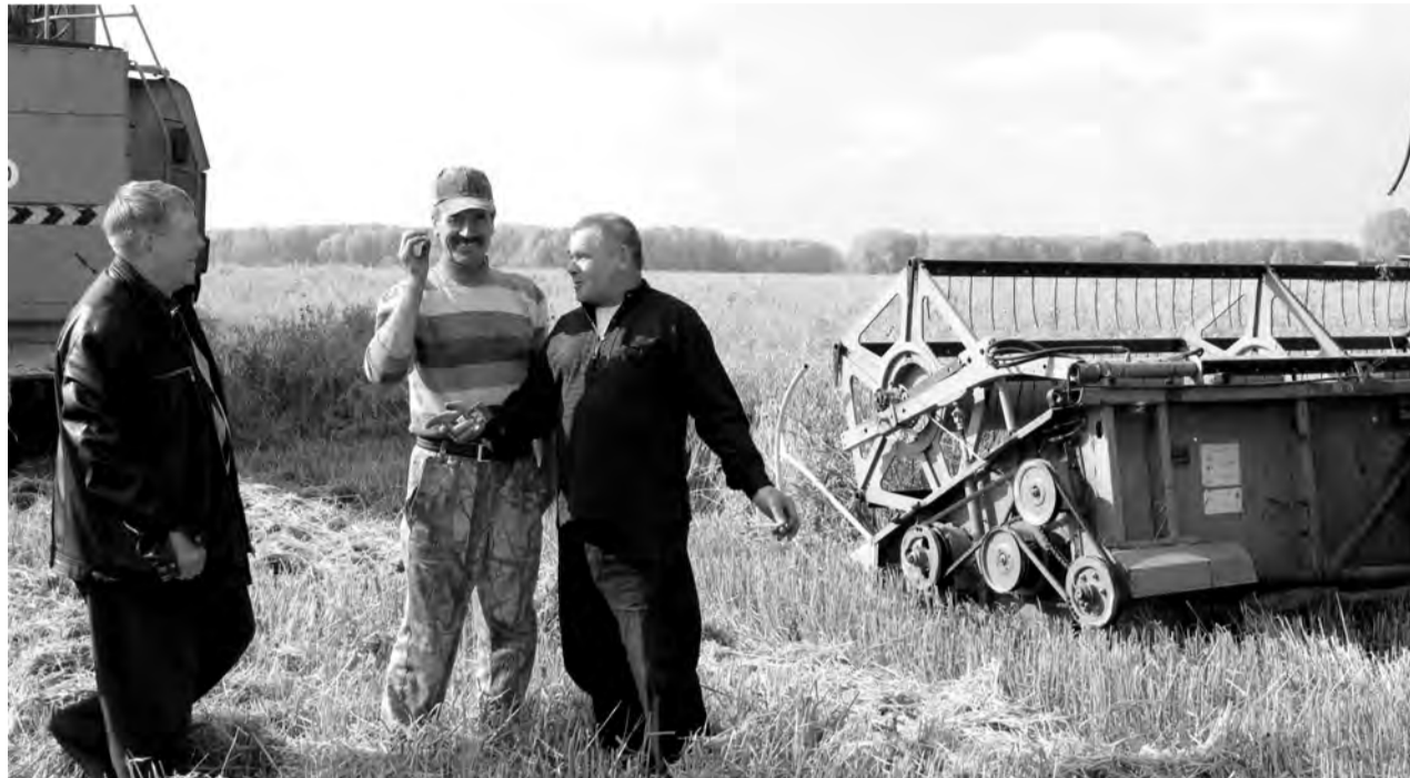
Разговор комбайнеров с председателем (слева)