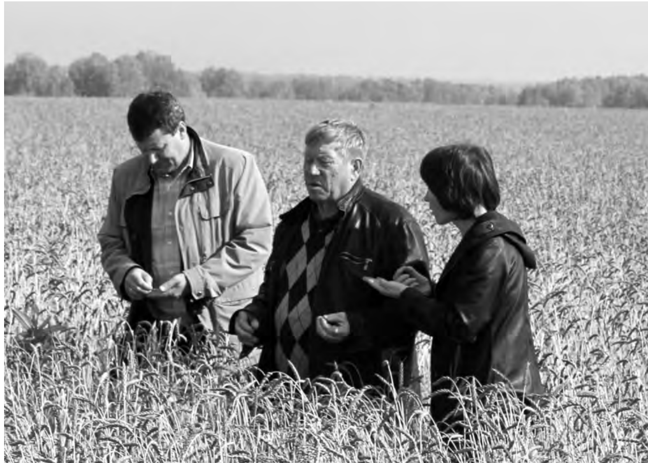
Пшеница нынче уродилась на славу