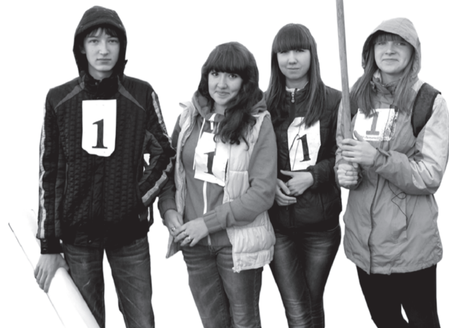
Участники - команда школы №1 - еще и активные болельщики!