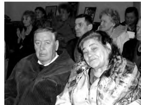
Встреча получилась душевной