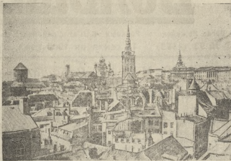
Панорама города Таллина (Эстонская ССР).