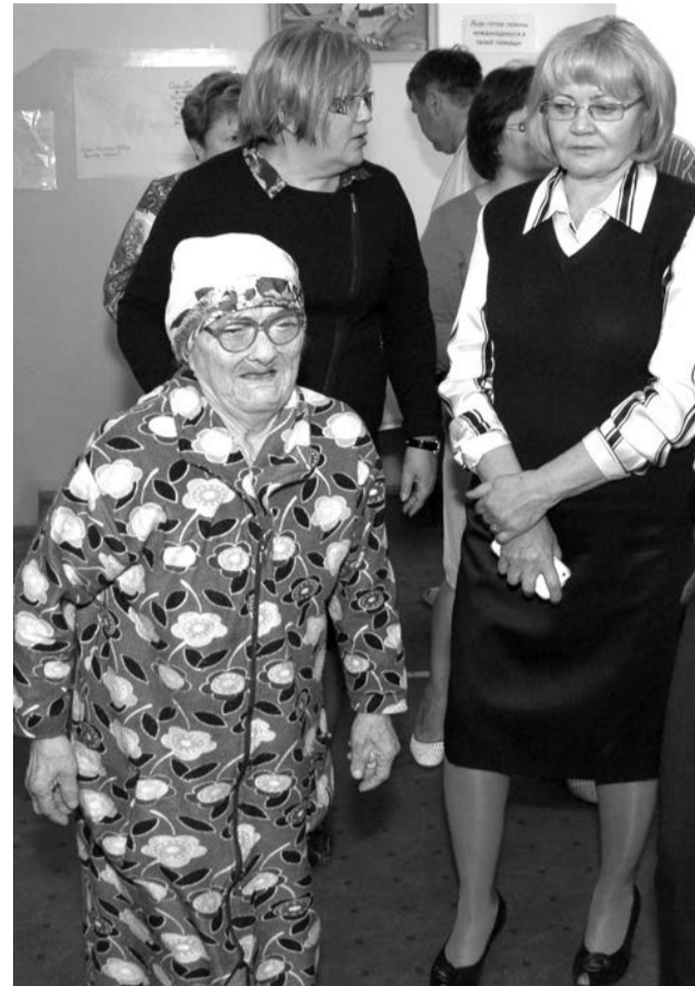
«Статус временного переселенца приравнивается к виду на жительство, и это позволит гражданам Украины получать пенсии»

Жители деревни Трехозерная попросили администра-