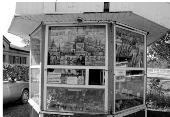
п. Пионерский, центр, киоск периодической печати.

Рады поделиться с вами новостью! Сейчас вы можете покупать нашу газету во всех крупных населенных пунктах Талицкого района! В поселковых магазинах, продающих нашу газету в розницу, вы также можете оставить бесплатное объявление, которое будет опубликовано в газете! Здесь продается «Сельская новь»!