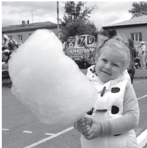
«Неужели я все это съем!»

А создавали праздничное настроение всем присутствующим танцевальные номера юных артистов. После торжественной части началась детская развлекательная програм-