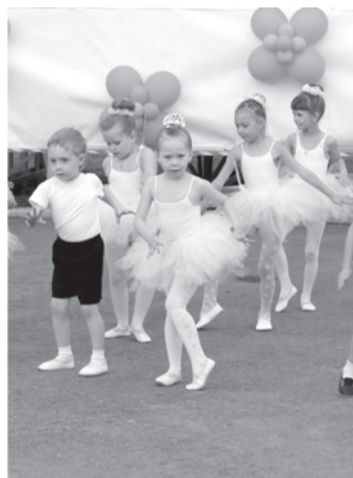
Маленькие артисты пос. Троицкого