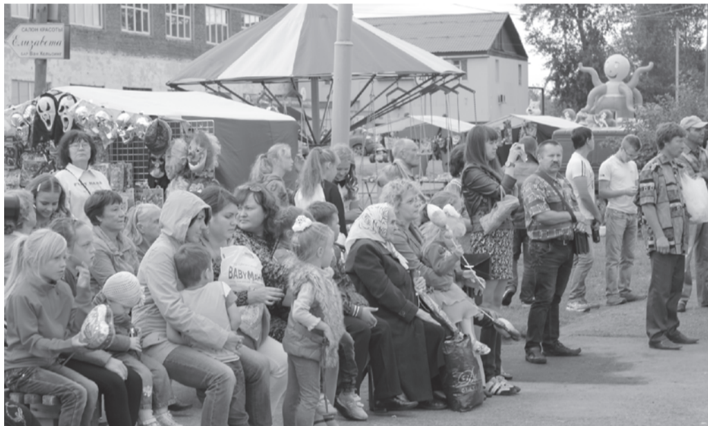
Главное богатство поселка - это его люди

ма с любимыми героями из советских мультфильмов.