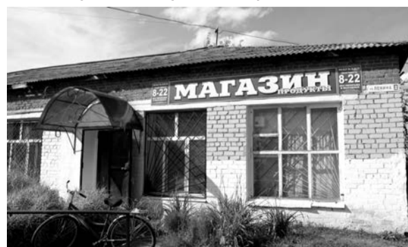
п. Кузнецовский, ул. Ленина-2, магазин «Продукты».