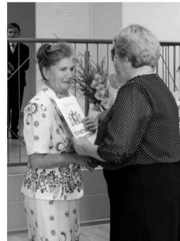
Вручение почетных грамот педагогам

Вторая часть конференции была посвящена докладам, в