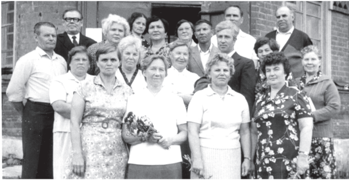
30.06.1984 г. Встреча выпускников Талицкого пед.училища выпусков 1955 и 1956 годов.

Каждая фотография должна сопровождаться информацией о том, когда и где она сделана, что на ней изображено (или кто изображен), от кого получена.