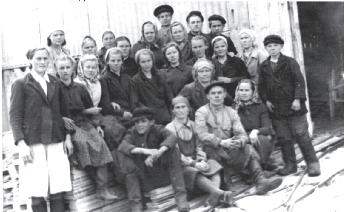
Июнь 1954 г. Лесоzавод № 2. 136 участок. Утилизационный цех.