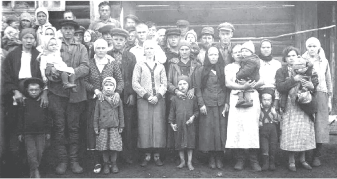
22 июня 1941 г. д. Упорова. Проводы на фронт.

Каждая фотография должна сопровождаться информацией о том, когда и где она сделана, что на ней изображено (или кто изображен), от кого получена.