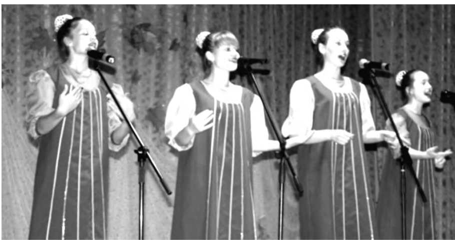
Вокальная группа «Маки»

В ДК «Центральный» прошла концертная программа хора «Уральские зори», вокальных групп «Желанушки» и «Млада», а также вокального дуэта «Маки», и называлась эта программа «Поем для Вас».