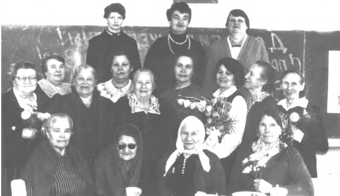
8 марта 1992 г. Встреча тружеников тыла и ветеранов труда школы-интерната.