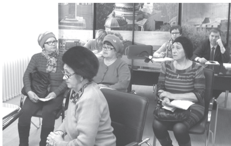
- Сколько можно терпеть от «Энергосбыта»?