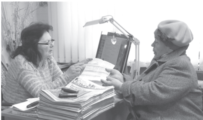
«Некорректные» начисления и у жильцов дома №88 по ул. Ленина (г.Талица)

Первыми забили тревогу жители с ул. Космонавтов, 1 п.Троицкого, которые в своем письме в «Единую управляющую компанию» пишут: