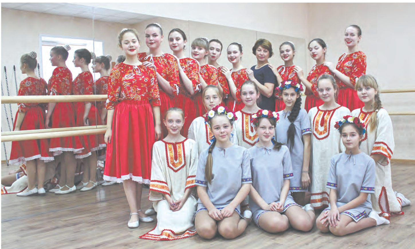
В хореографическом классе коллектив «Гармония»