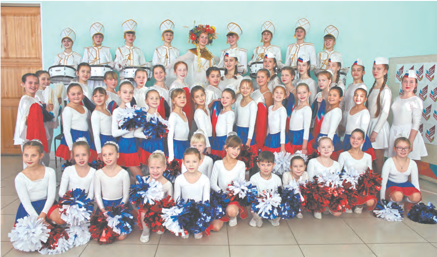
Большой и дружный коллектив «Радуга»