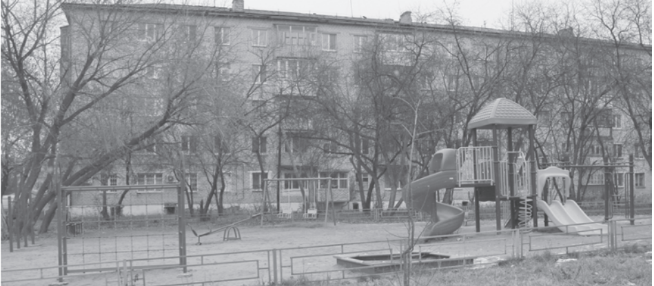
К таким дворам будем стремиться (ул. Ленина, г. Талица)

Для начала собственники многоквартирных домов должны быть сами заинтересованы в том, чтобы их дом стал участником муниципальной программы. Инициативная группа собственников помещений должна провести собрание собственников жилья. Его участники должны проголосовать за вступление в муниципальную программу, определить размер софинансирования (в среднем до 5 процентов от стоимости проекта), а также утвердить эскизный дизайн-проект. Там могут быть учтены все пожелания, но главное, что должно быть,