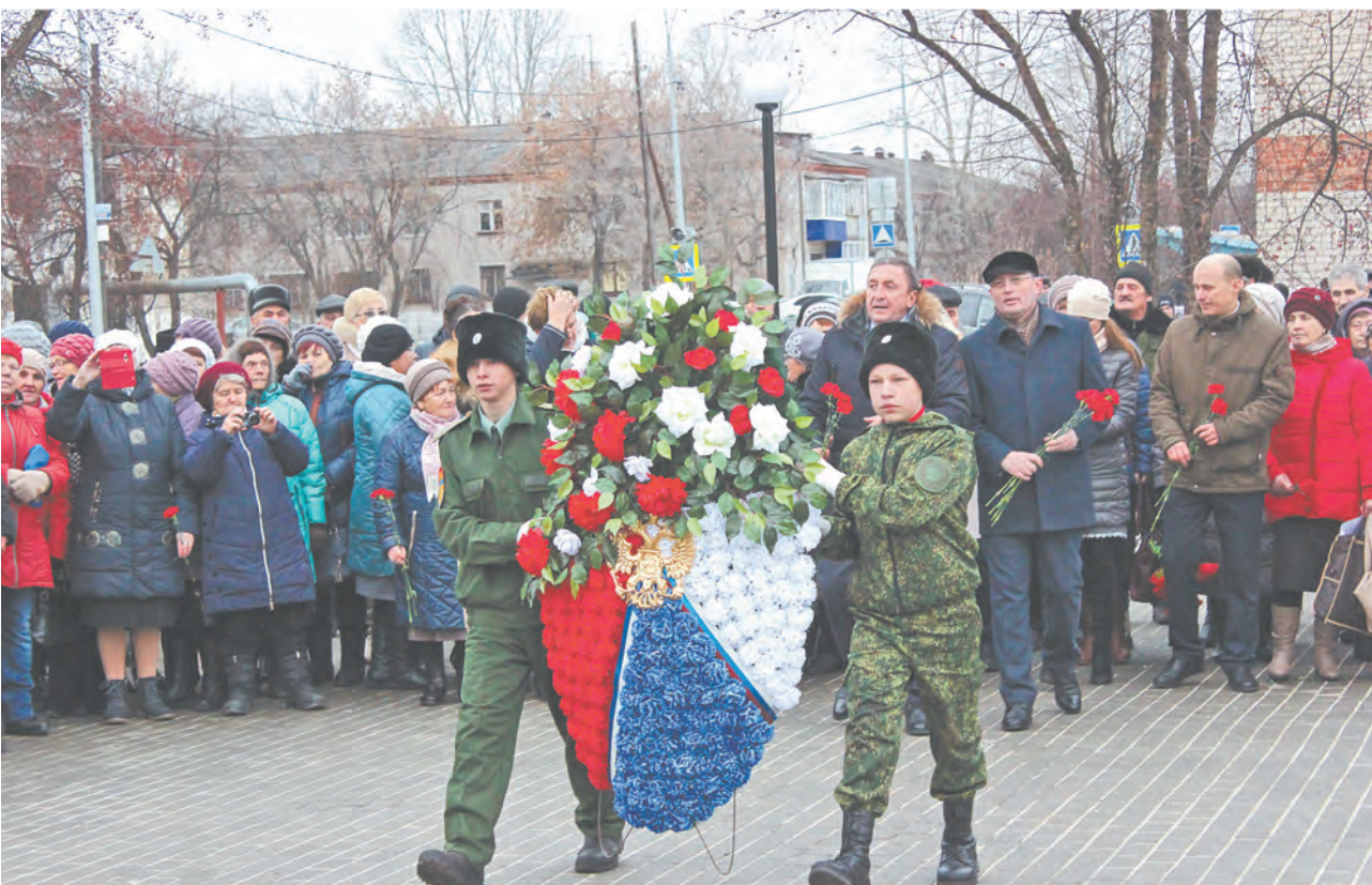
Возложение венков к обновленному памятнику

- Имя Кузнецова – это национальное достояние, и мы должны сделать так, чтобы наше подрастающее поколение знало имя Героя Советского Союза. Такие люди как Н.И.Кузнецов обеспечивали победу и безопасность. Благодарю всех жителей за то, что в поселке хранится память о Герое. Надеюсь, что мои коллеги - работники образования, культуры сделают все возможное, чтобы имя Героя не забывало молодое поколение.