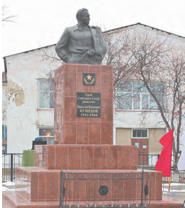
Памятник Н.И. Кузнецову после реставрации

На родине легендарного разведчика состоялось открытие памятника Герою Советского Союза Николаю Кузнецову после капитального ремонта.