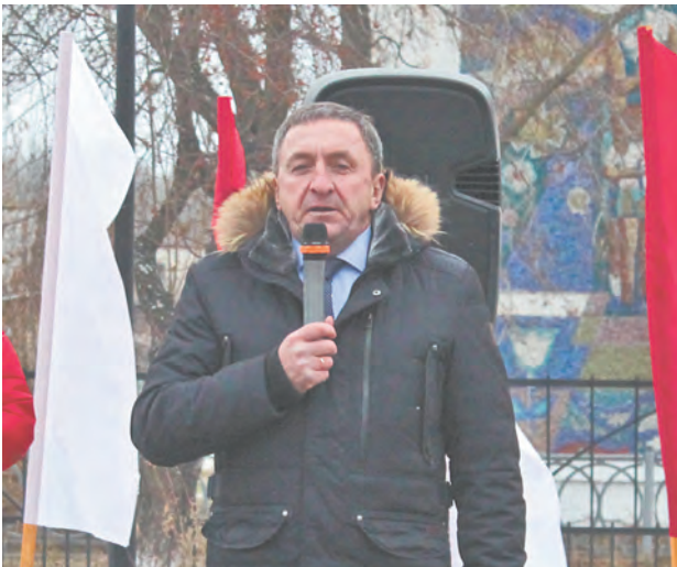
Глава ТГО Александр Толкачев

Почетными гостями стали заместитель губернатора