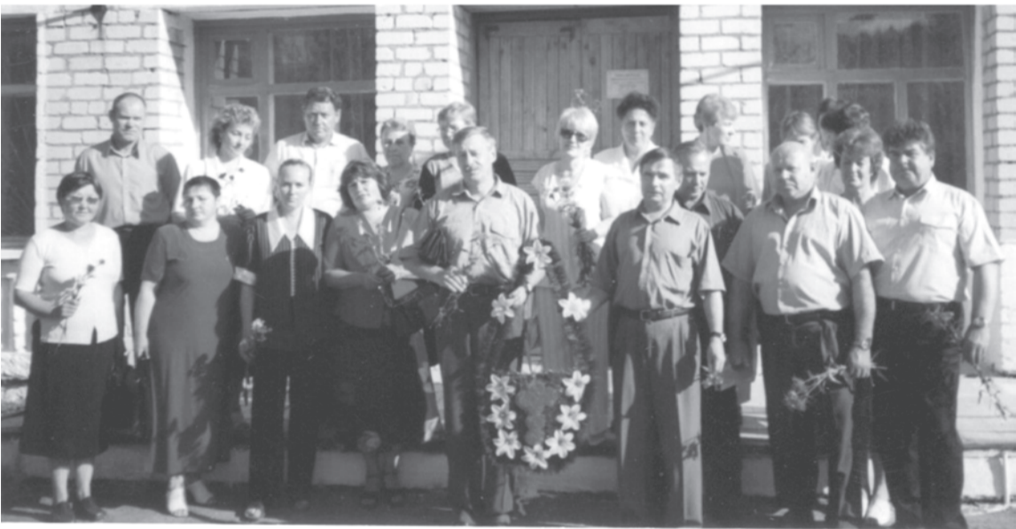
2002 г. Совещание в Кузнецовской управе.