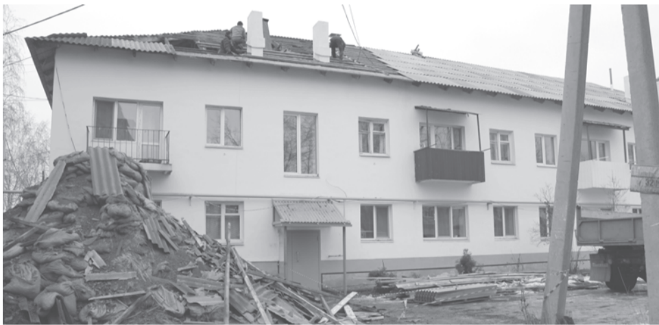
г. Талица, ул. Пушкина, 2А

В этом году работы по программе капитального ремонта общего имущества ведутся на 18 многоквартирных домах Талицкого ГО.