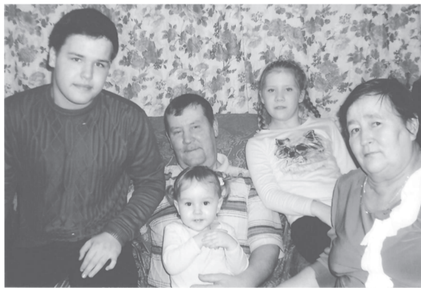
Семья Кузнецовых с внуками