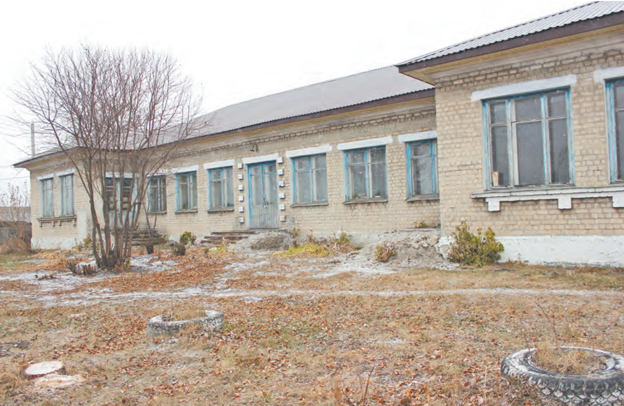
Общий вид библиотеки. В скором времени здесь появится парковка для автомобилей

юбилей. С приходом молодого специалиста в данной библиотеке удалось создать студию детского развития «Лесенка», которая пользуется спросом у молодых мам и их малышей в возрасте до трех лет.