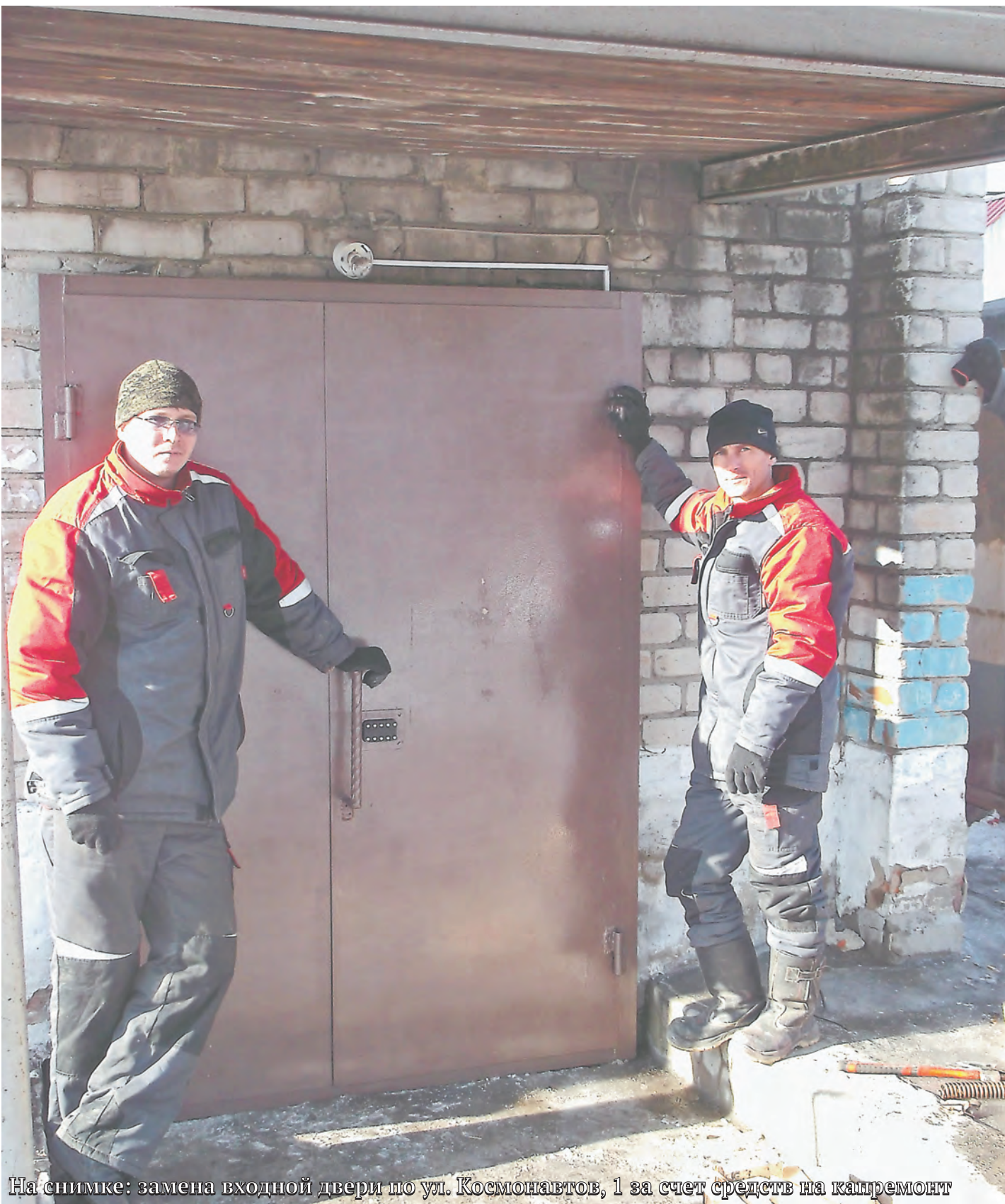
На снимке: замена входной двери по ул. Космонавтов, 1 за счет средств на капремонт

Куда платит, а главное – как контролировать расходование средств – зависит от самих собственников МКД.....3