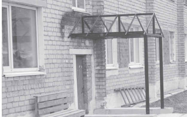
Улица Космонавтов, п. Троицкий

Этим вопросом задается большая часть жителей многоквартирных домов