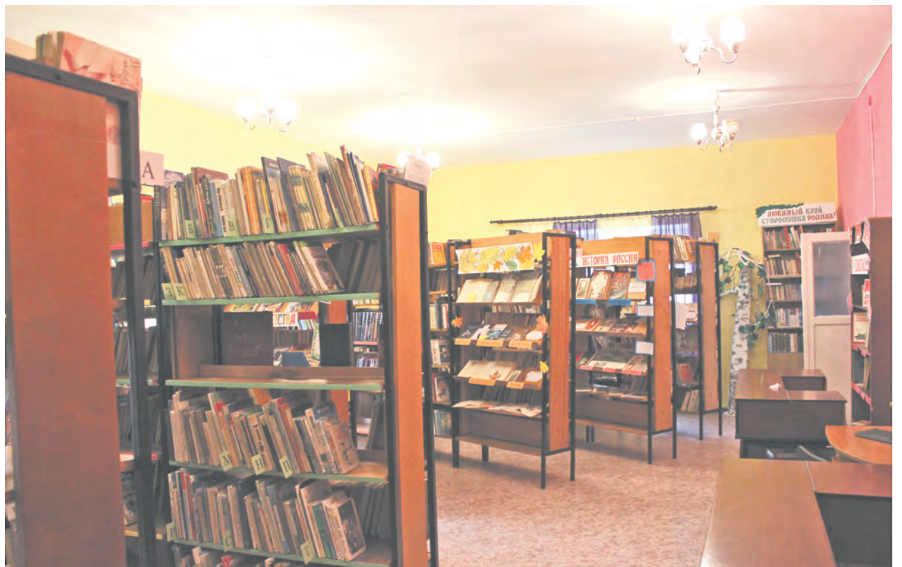
Обновленный зал детского отделения

Так, в 2014-2015 году грант в размере 1 миллиона рублей выиграла Горбуновская библиотека, после чего более 500 тысяч рублей были выделены из районного бюджета. В 2015-2016 году грант получила Талицкая центральная районная библиотека, затем там был проведен ремонт, присвоено имя Поклевских-Козелл, а далее получена премия губернатора Свердловской области. В 2017 году был проведен ремонт и приобретена мебель для библиотеки пос.РТС. В этом году библиотека отмечает 60-летний