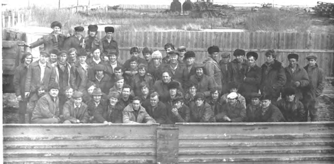
1973 г. Водители СХТ на уборке урожая в Кургане.