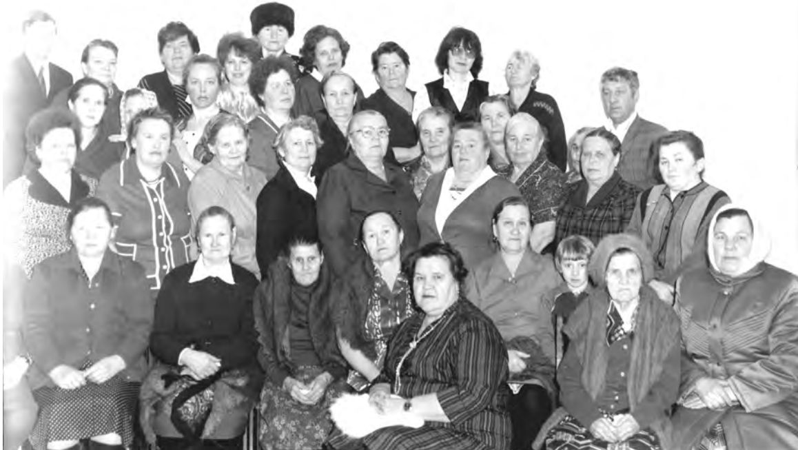
6 марта 1989 г. Библиотека пос. РТС на вечере «День любви и уважения».

тий, старых зданий, природных ландшафтов, а также групповые, одиночные или семейные портреты. Каждая фотография должна сопровождаться информацией о том, когда и где она сделана, что на ней изображено (или кто изображен), от кого получена.