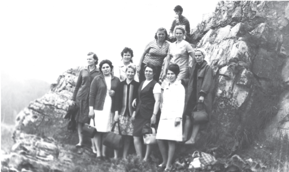
1972 г. Санаторий «Курьи» Сухоложского района. Знакомство с территорией санатория.