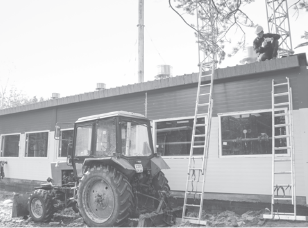
Строит газовую котельную, выйдя на финишную прямую, ЗАО «Регионгазинвест», и в дальнейшем оно же будет ее эксплуатировать, так же, как и все остальные газовые котельные в районе.

Новая газовая котельная в восточном микрорайоне города уже в этом году заменит две маломощные газовые и одну угольную (№9).