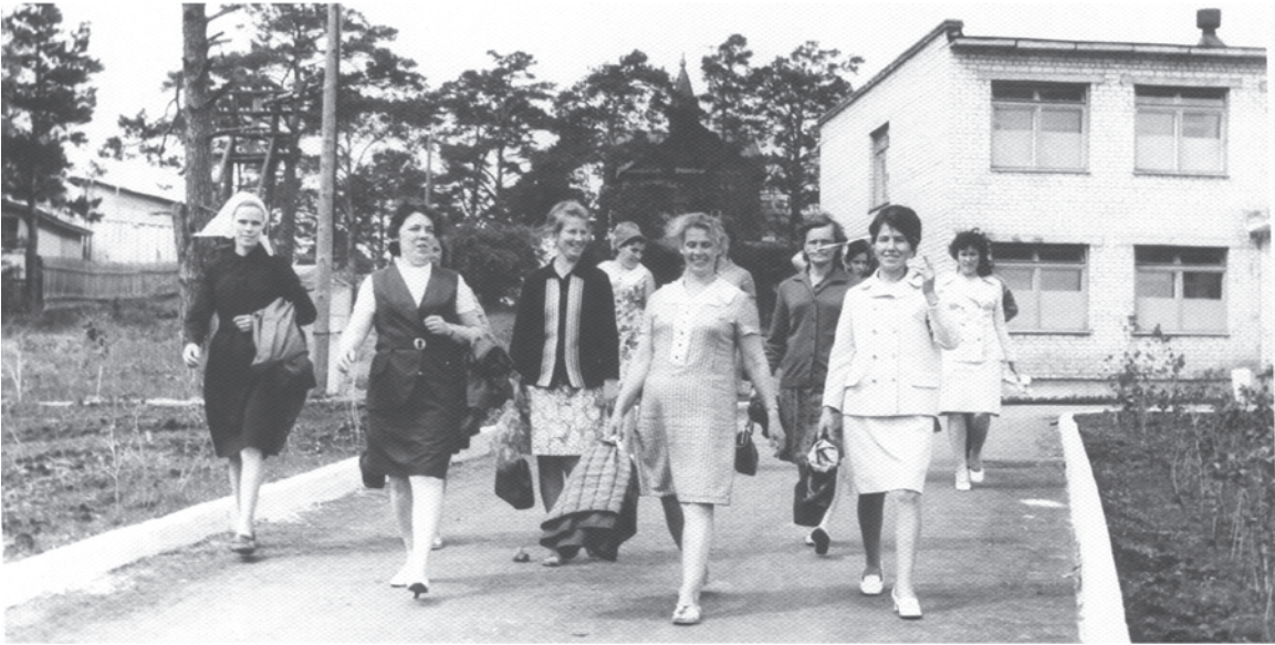
Поездка по обмену опытом работников Талицкого управления бытового обслуживания населения в г. Сухой Лог. Фото 1972 г. Санаторий «Курьи».

тий, старых зданий, природных ландшафтов, а также групповые, одиночные или семейные портреты. Каждая фотография должна сопровождаться информацией о том, когда и где она сделана, что на ней изображено (или кто изображен), от кого получена.