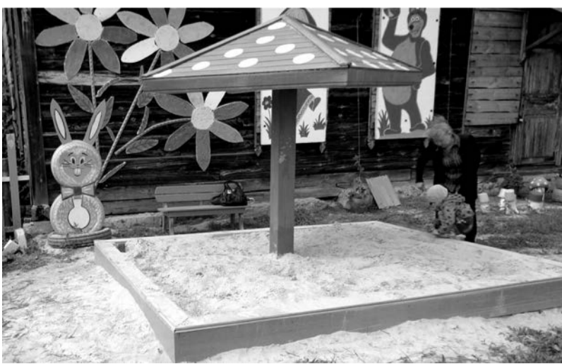
с. Басмановское, детская площадка