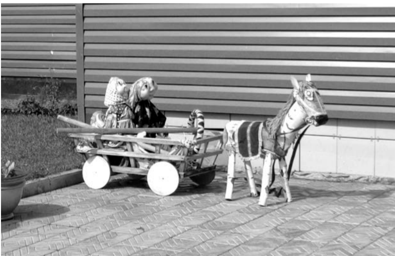
Рукотворная красота в д.Бор

- Для участия в областном конкурсе «Лучшая сельская усадьба, село, деревня - 2014»: