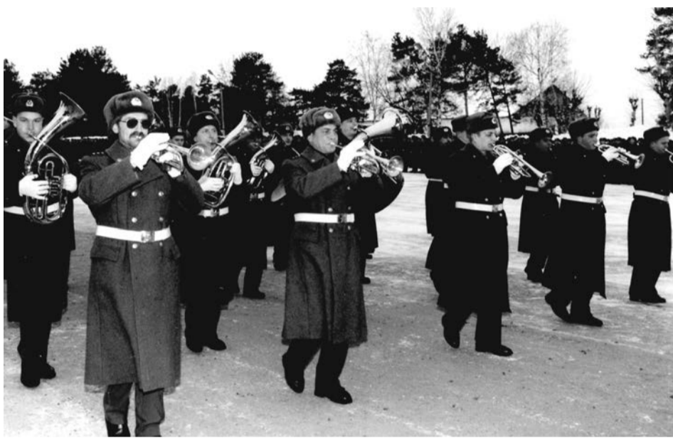
Играет военный духовой оркестр