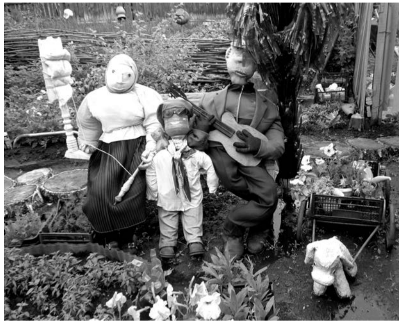
В усадьбе Поздеевых (д.Вихляева)

улиц, ухоженность домов, придомовых территорий» первое место решено присудить деревне Трехозерная Трехозерской управы, второе место присудить селу Басмановское Басмановской управы и третье место - селу Куяровское Куяровской управы;