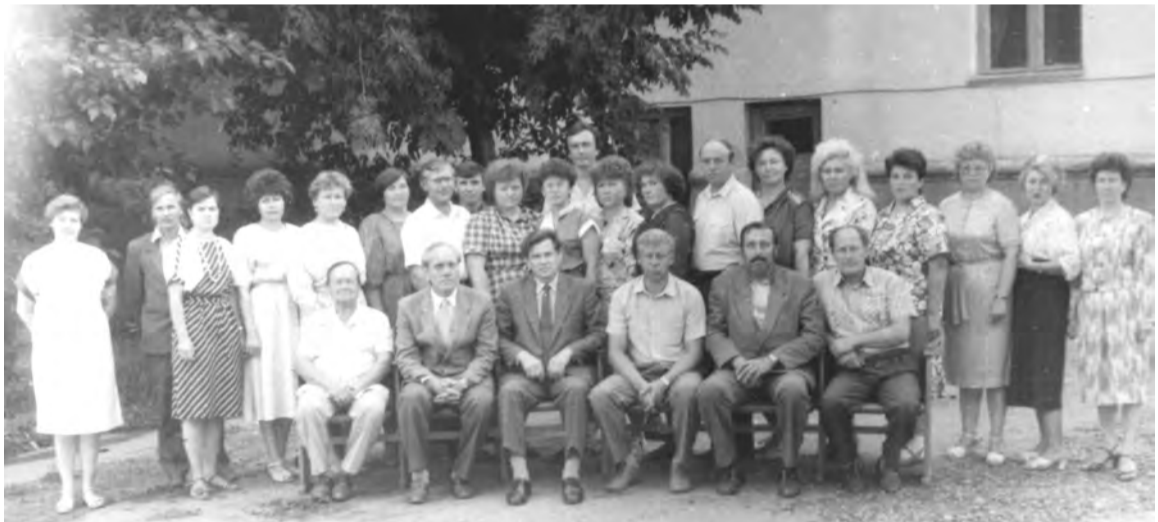
1989 г. На снимке: аппарат Талицкого РК КПСС.