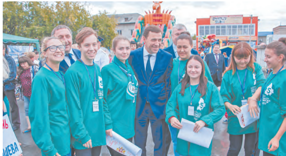
Проблемы молодежи надо знать, - убежден Евгений Куйвашев, - потому что в них - планы на будущее

Открывая торжественную часть праздника, Александр Толкачев подчеркнул, что юбилей города – это праздник всех таличан, это день единения тех, кто жил, кто поднимал, защищал, строил... Талицкая земля известна своими патриотами – легендарный разведчик