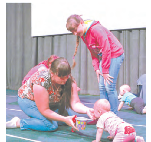
- Вот и подкармливаю малиной, чтобы ползла быстрее...