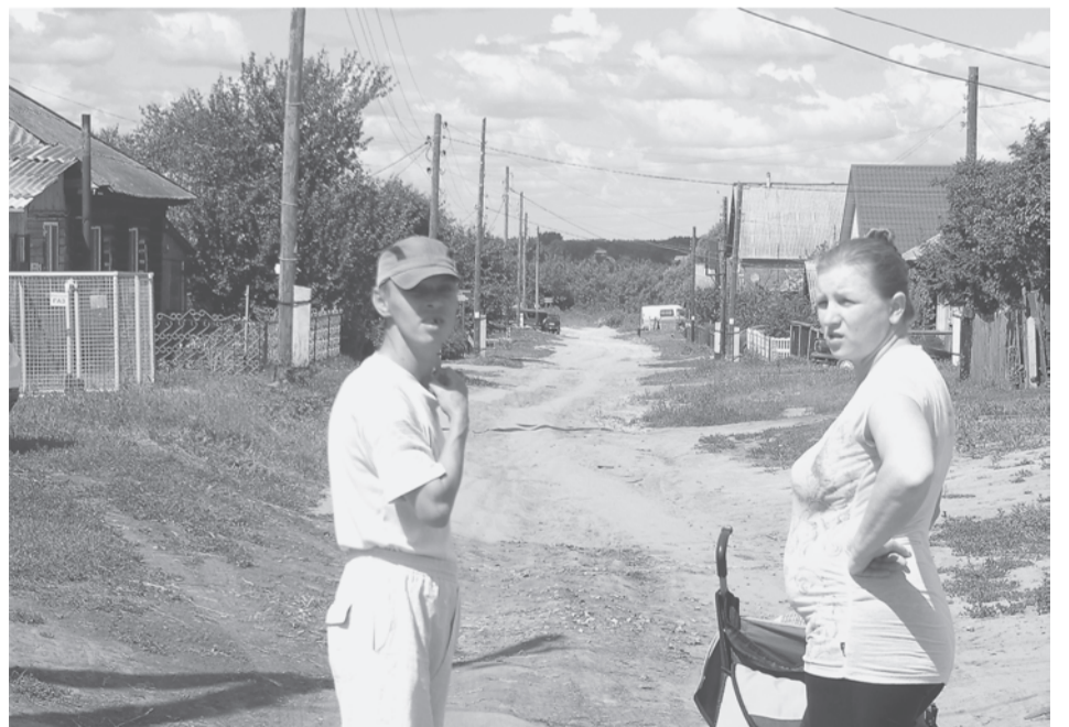
По нашей улице Кирова и в сухую-то погоду проехать трудно...

По освещению перекрестков улиц города, а таковых у нас запланировано 135 световых точек, вопрос в прямом смысле «застолбился», т.к. «Облкоммунэнерго» требует арендную плату за каждый столб, на который мы повесим светильники. Плата эта составляет 181 руб. в месяц. Перемножим рубли, светоточки на 12 месяцев в году и получим кругленькую сумму – порядка