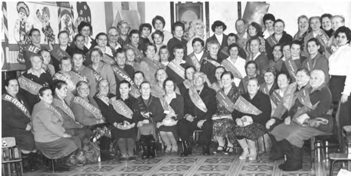
5 декабря 1987 г. Вечер-встреча ветеранов труда детских садов Taliцкогo района.

тий, старых зданий, природных ландшафтов, а также групповые, одиночные или семейные портреты. Каждая фотография должна сопровождаться информацией о том, когда и где она сделана, что на ней изображено (или кто изображен), от кого получена.