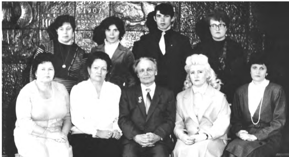
26.03.1987 г. Делегаты от Taliцкогo района на областной учительской конференции.