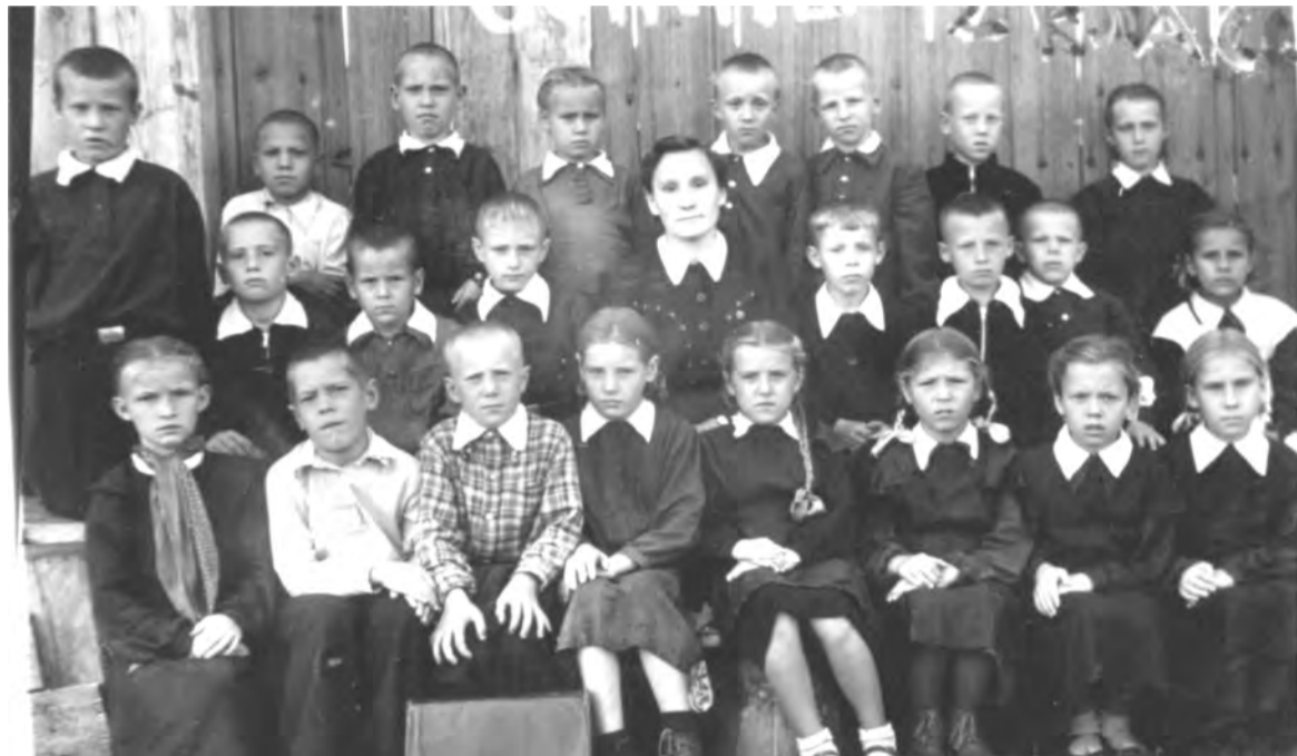
1957 г. Еланская школа. 2 класс. Учитель Рябкова В. П.

Каждая фотография должна сопровождаться информацией о том, когда и где она сделана, что на ней изображено (или кто изображен), от кого получена.