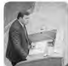
1-я программная статья «Сохраним опорный край Державы»