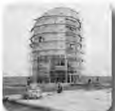
Началось строительство ОЭЗ «Титановая долина»