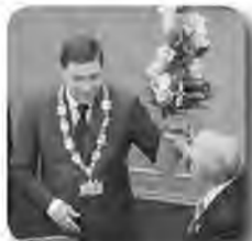
Евгений Куйвашев назначен губернатором Свердловской области