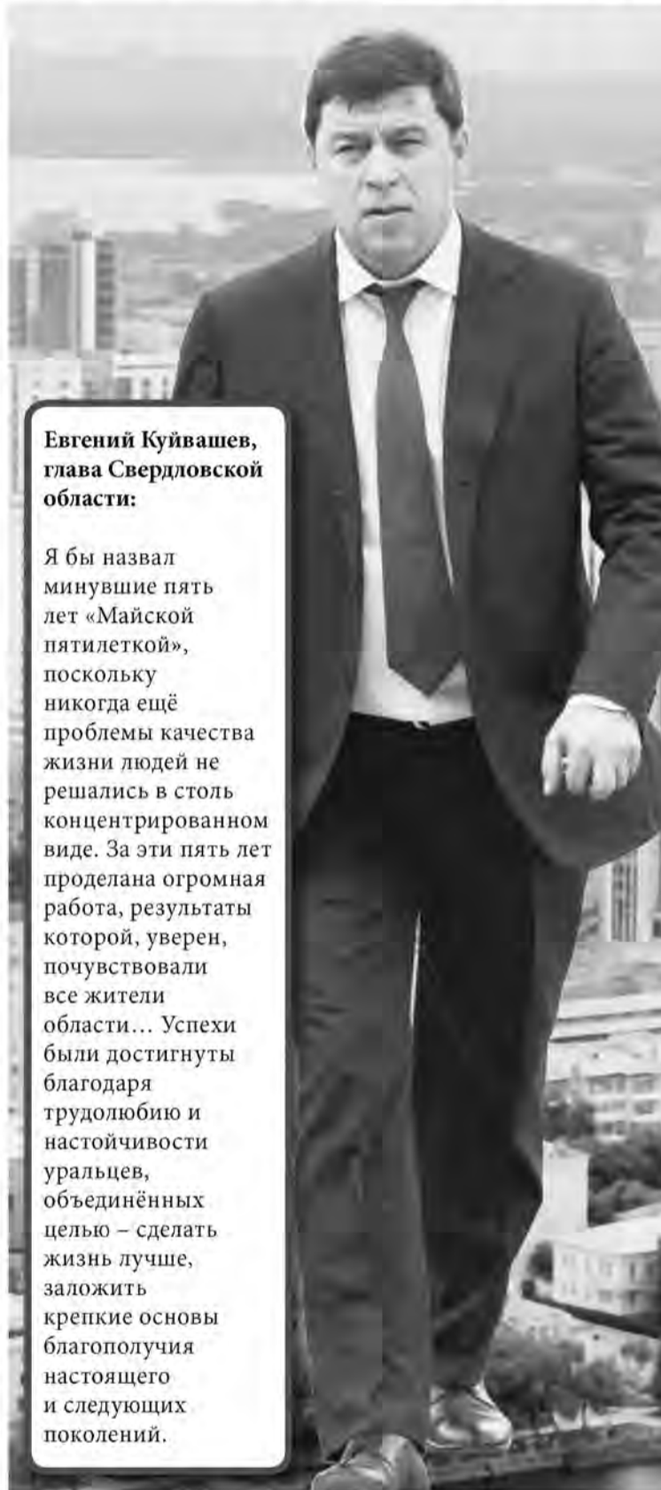
Евгений Куйвашев, глава Свердловской области: