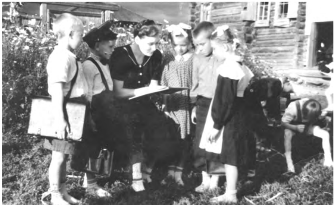
1956 г. Еланский детский сад. Встреча с первой учительницей Рябковой В.П.