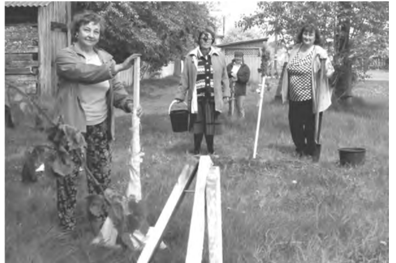
Идет посадка лип

В день празднования с утра в саду звучала красивая музыка, потихоньку собирались все желаю-