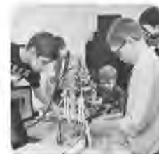
Создание «Уральской инженерной школы»