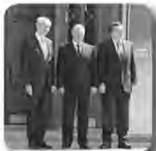
Евгений Куйвашев в Топе-20 губернаторов РФ