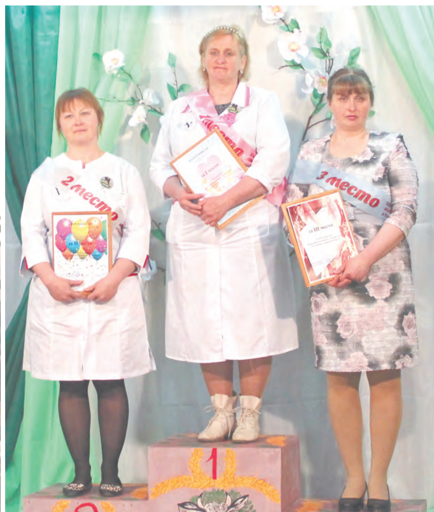
Призёры XIX районного конкурса