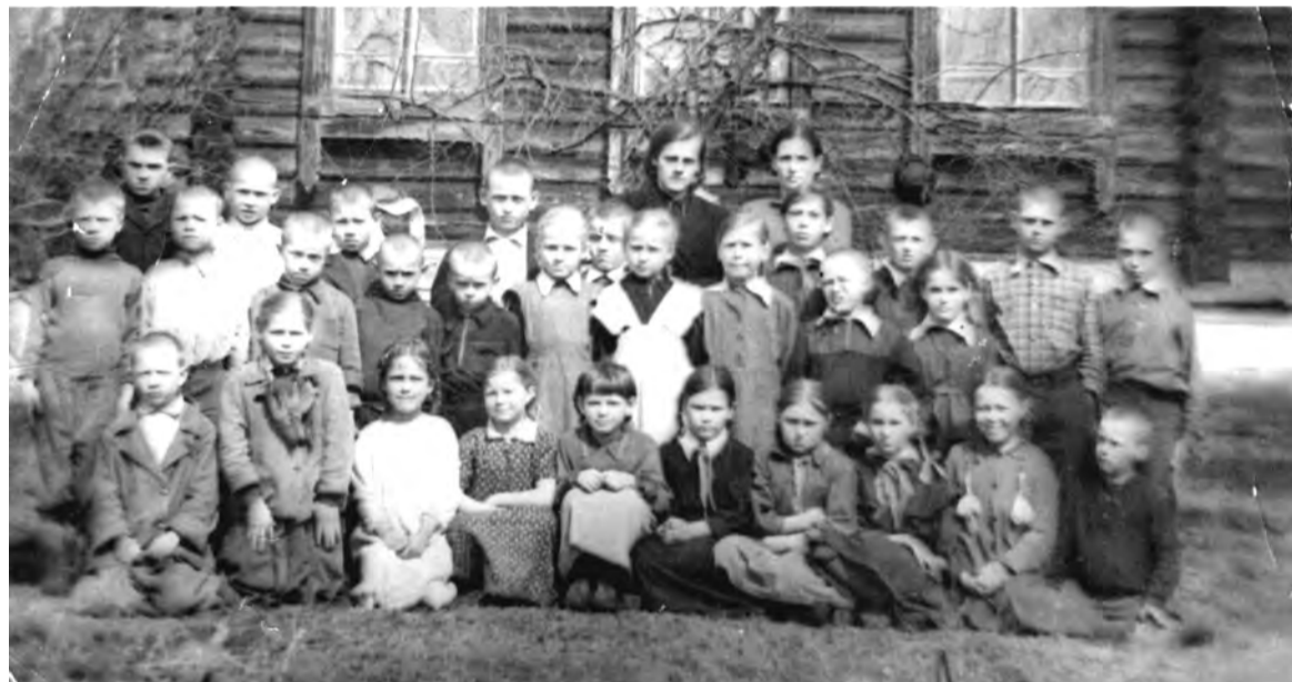
1955-1956 г. Антоновская школа.