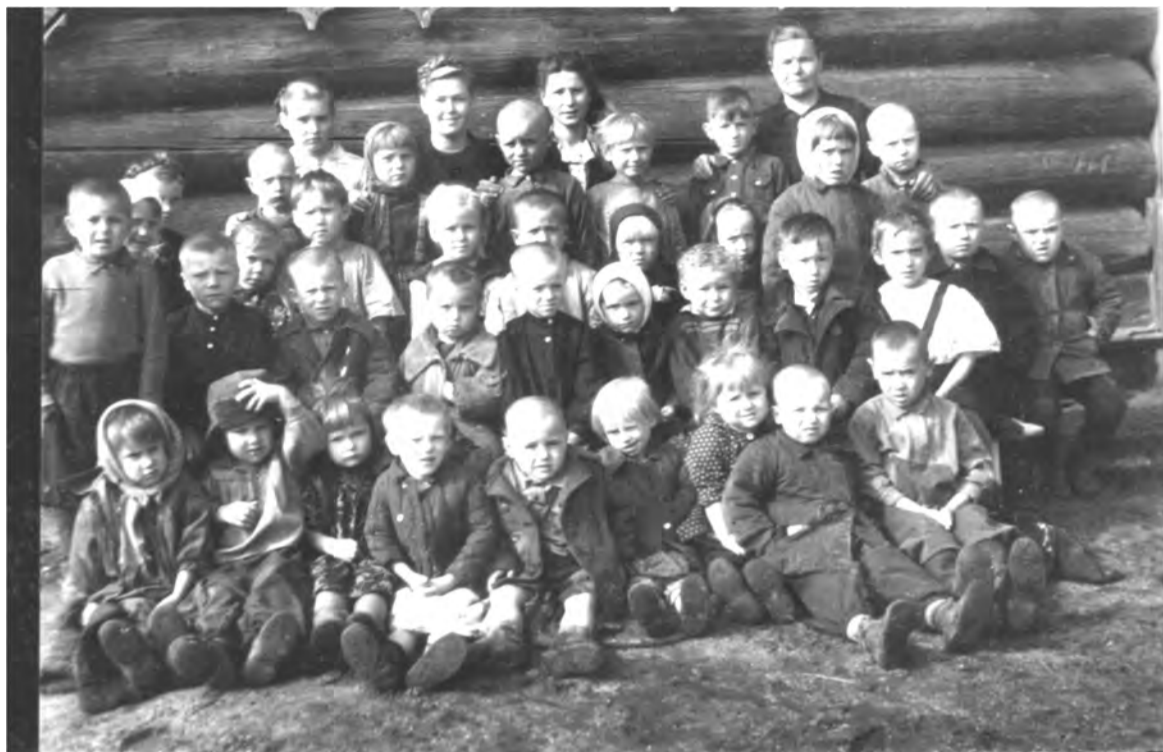
1954-1956 г. Антоновский детский сад.

тий, старых зданий, природных ландшафтов, а также групповые, одиночные или семейные портреты. Каждая фотография должна сопровождаться информацией о том, когда и где она сделана, что на ней изображено (или кто изображен), от кого получена.