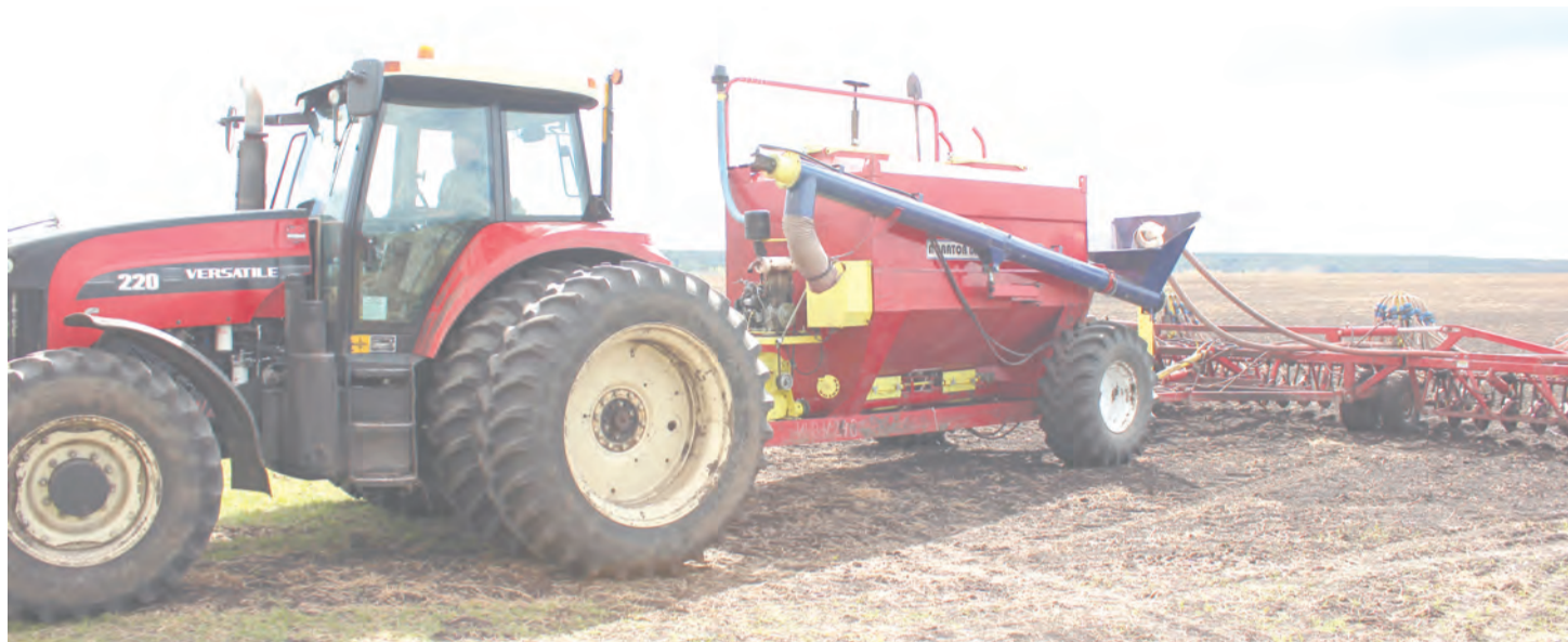
Посевной агрегат готов к работе

Всего в посевной кампании участвуют двадцать механизаторов и севачи