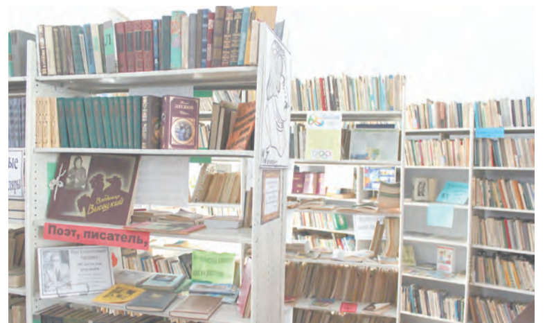
Книжный фонд библиотеки