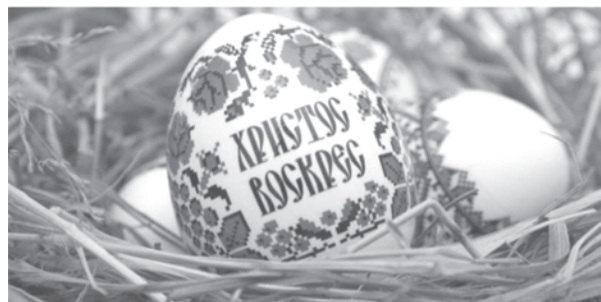
Уважаемые жители Талицкого городского округа!

От всего сердца поздравляем вас с окончанием Великого поста и Светлым Христовым Воскресением.