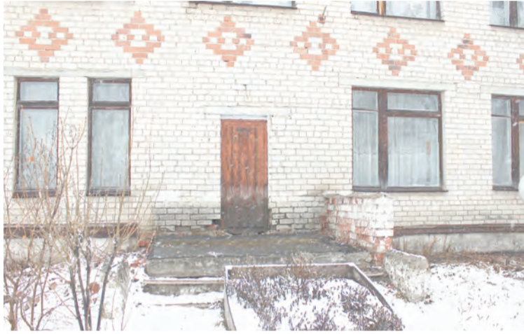
Здесь будет парадный вход в ДК

здесь собирают историю о поселке, жителях и предприятиях. Хорошим дополнением стала воссозданная русская изба на втором этаже здания. Белые вышитые занавески, русская печь, кровать, заправленная на старый лад, деревянный комод, стеклянная посуда столетней давности – все это самостоятельно собрали и отреставрировали работники Дома культуры. Здесь же можно увидеть настоящий ткацкий станок 1900 года выпуска, старинное радио, бобинный магнитофон, гармошку. Частыми гостями настоящей русской избы на нескольких квадратных метрах становятся учащиеся троицких школ, воспитанники детских садов поселка и официальные лица района.