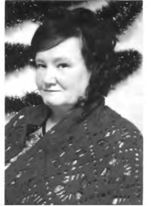
СПК 8-е Марта и Совет ветеранов

В день юбилея годы можно не считать, В этот самый день счастливый Мы хотели б пожелать: Пусть морщинки, но от смеха, Не беда и седина, Пусть слезинки, но от счастья Вам сопутствуют всегда. Пусть будет в доме мир, а в сердце счастье. Пусть сбудутся заветные мечты, Пусть будет ваша жизнь всегда прекрасна, Полна любви, добра и красоты!