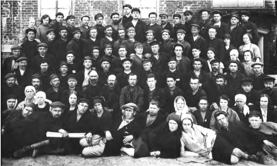
Коллектив рабочих талицких дрожжезаводов. Конец 20-х, начало 30-х годов 20 века. Фото А. Е. Ельцина.

тий, старых зданий, природных ландшафтов, а также групповые, одиночные или семейные портреты. Каждая фотография должна сопровождаться информацией о том, когда и где она сделана, что на ней изображено (или кто изображен), от кого получена.