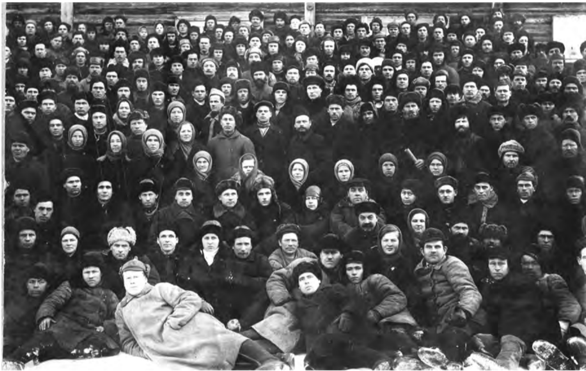
Первая Талицкая районная сельскохозяйственная конференция. 17-21.01.1933 г.