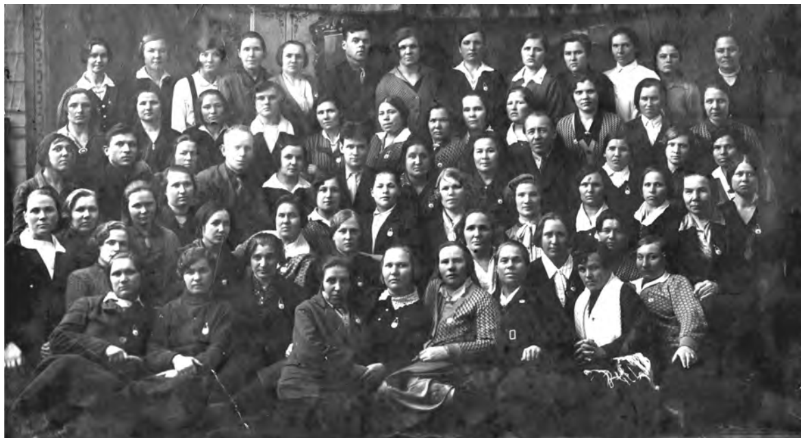
Областные 2-мес. курсы по переподготовке женщин - председателей с/советов. Декабрь-январь 1936 г. в г. Челябинске.

тий, старых зданий, природных ландшафтов, а также групповые, одиночные или семейные портреты. Каждая фотография должна сопровождаться информацией о том, когда и где она сделана, что на ней изображено (или кто изображен), от кого получена.