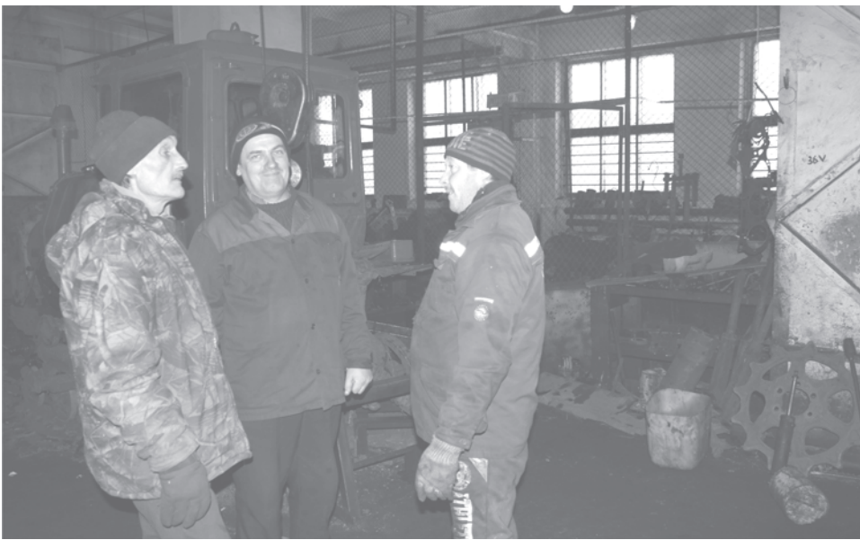
Ремонтно-восстановительная бригада СПК «Комсомольский»

- Всего на проведение весенне-полевых работ в Талицком городском округе требуется сумма в размере 161 миллиона рублей