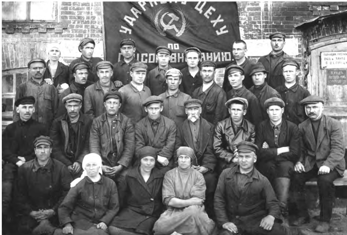
Ударный краснознаменный цех винного завода. 20 - 30 годы 20 века.