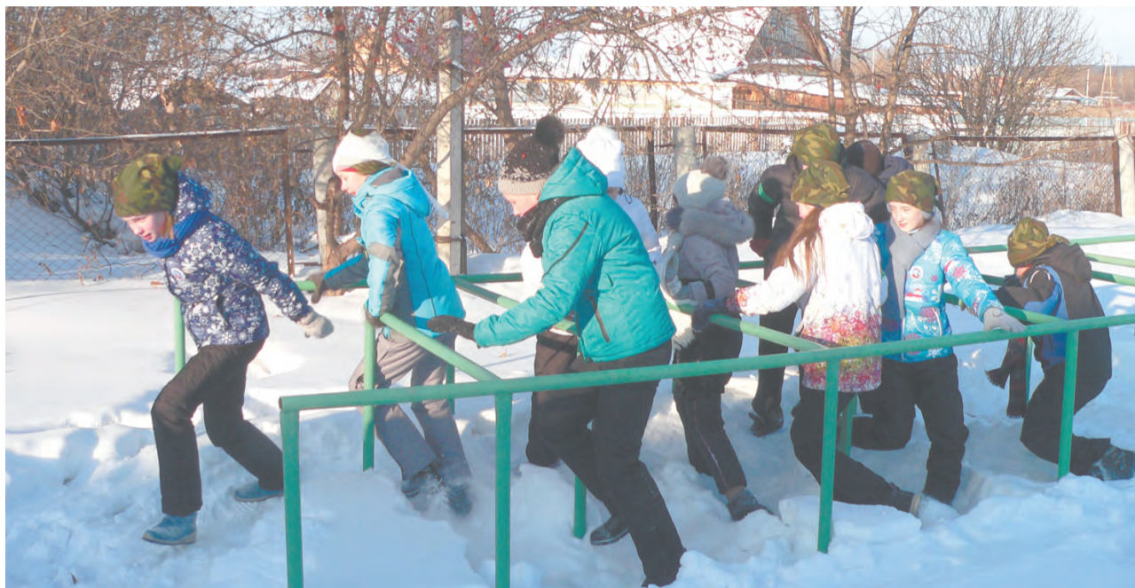
Это непростое испытание - пробежать в лабиринте по глубокому снегу