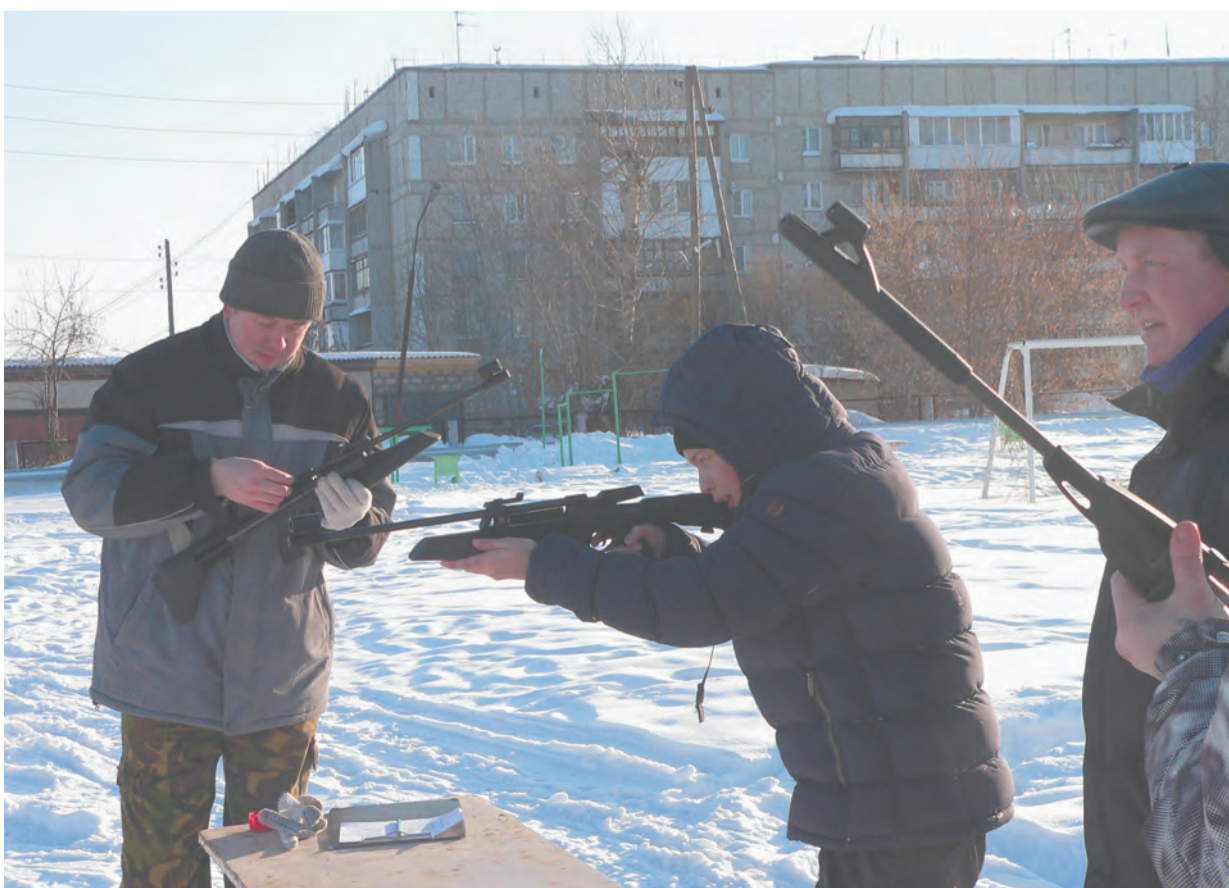
Растут меткие стрелки для Российской Армии

ким танкам (сделаны макеты), и с шумом, криками поддержки бегут на построение.