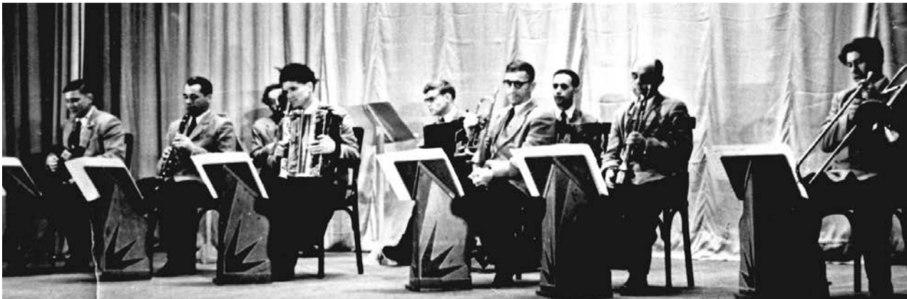
Выступление оркестра в Свердловской филармонии