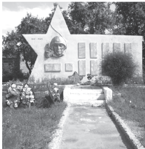
Памятник в с. Беляковском

Особенность территории такова, что там две ветеранские организации – в самой деревне Мохиревой и в с. Беляковка. По решению управы и первичек, работа там будет объединена. Еще до начала акции мохиревцы уже создали рабочую группу, подняли свои архивы и